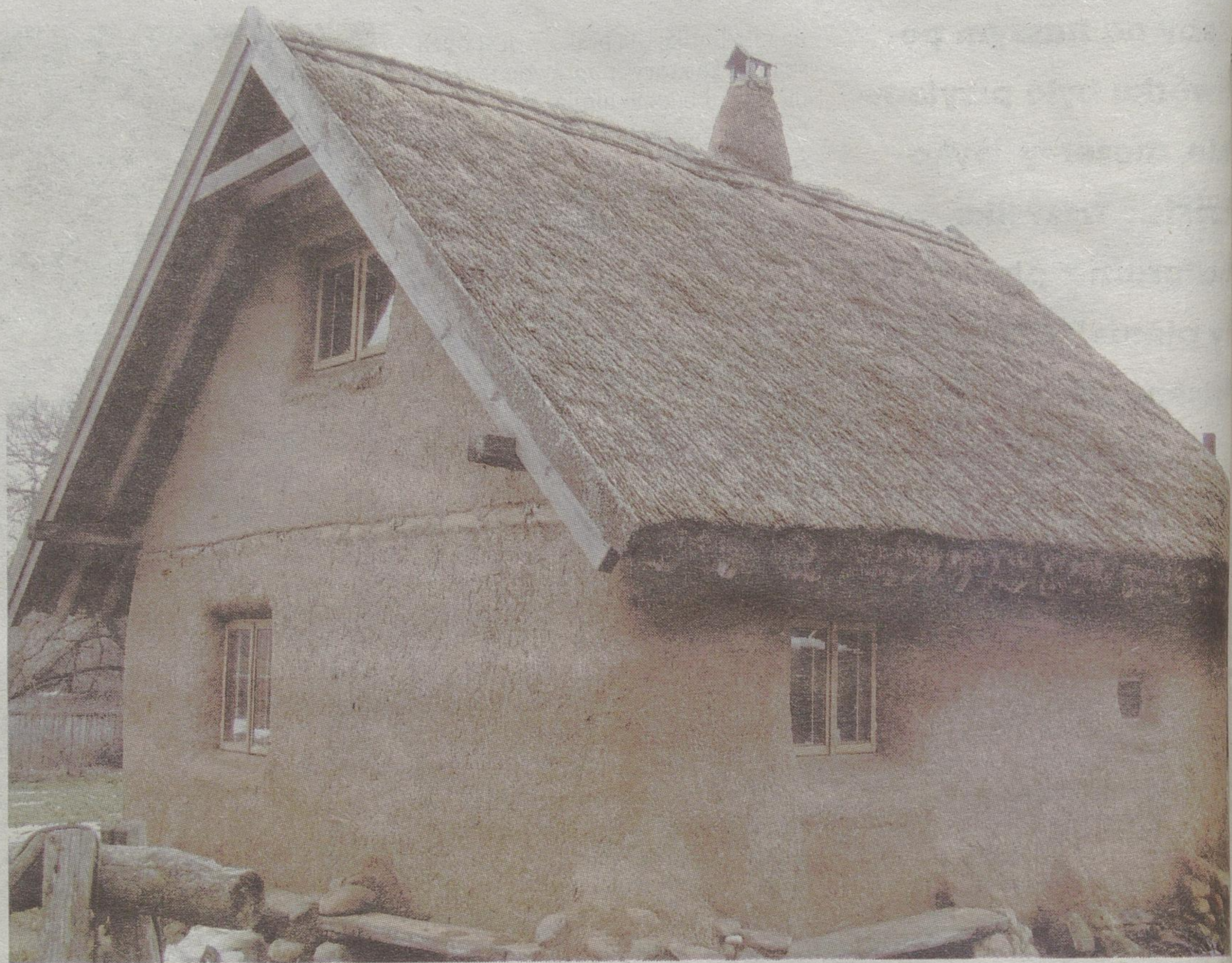
W takim domu można mieszkać przez cały rok

Następnym etapem jest tynkowanie – jest to najbardziej pracochłonna czynność, która polega na narzuceniu na ściany i wyrównaniu glinianego tynku o grubości 6-8 cm od wewnątrz i 10 cm od zewnątrz.