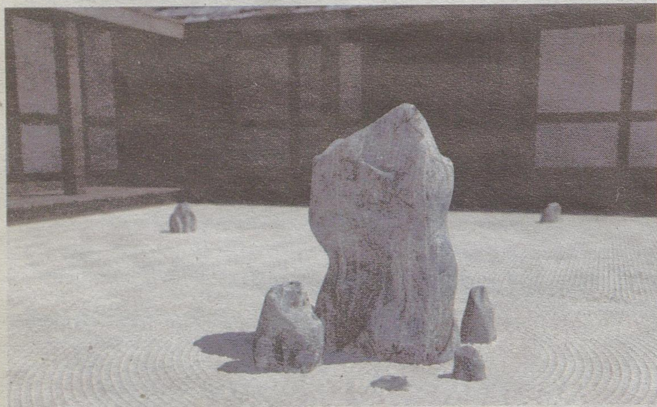
Płaskie, suche ogrody karesansui tworzą sanktuarium, w którym odpoczywa dusza

Żeby mieć ogród japoński, trzeba mieszkać w Japonii. Nie da się go przeszczepić na inny grunt, tak jak nie da się zastosować orientальной kaligrafii do polskiego alfabetu. Bambusowe plotki, lampiony, kamienne mostki to ważne elementy, ale kwintesencja ogrodu wyraża się w sercu, tradycji i kulturze ogrodnika. Możemy jedynie próbować stworzyć nastrój harmonijnej, a jednocześnie złożonej natury światła i zawrzeć w przestrzeni naszego ogrodu. A właśnie duch – nie materia – jest w ogrodzie japońskim najważniejsza.