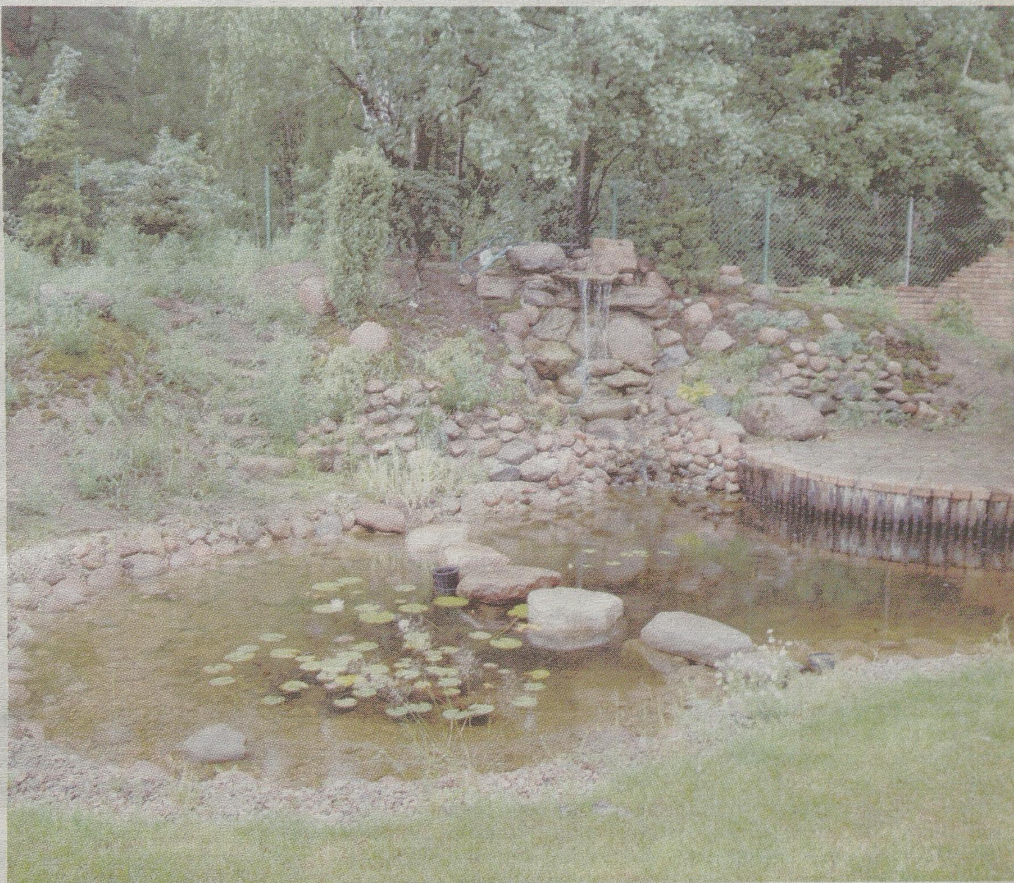
Oczko wodne można formować na wiele sposobów, tworząc np. kaskady

W oczku wodnym konieczne są też rośliny – oprócz tego, że pięknie wyglądają, dają również cień rybkom. Poza tym możemy je uatrakcyjnić, budując choćby sztuczny strumyk czy kaskadę wodną. Dobrze zrobione naprawdę mogą imitować naturalne.