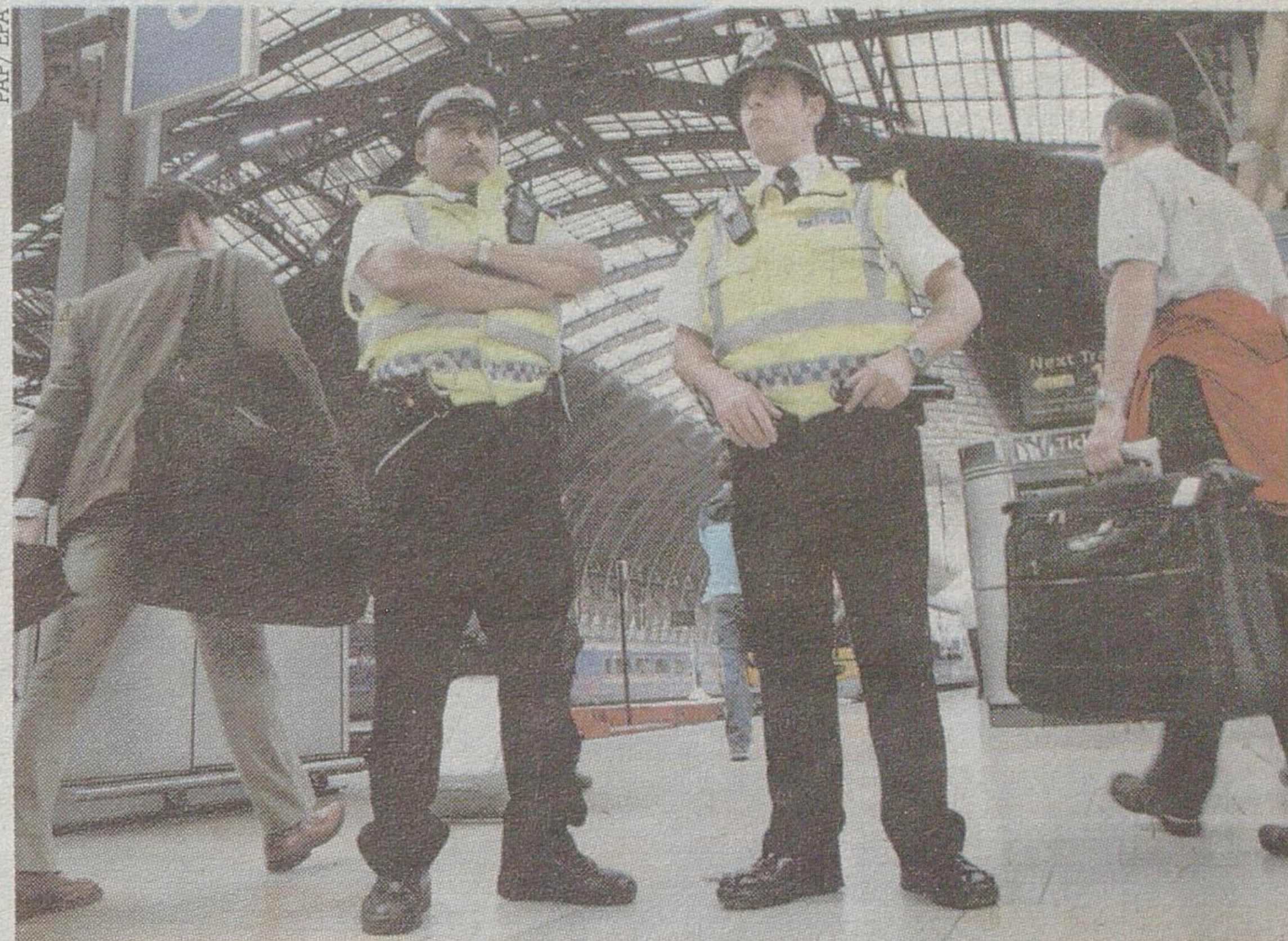
Dwaj policjanci na Paddington Station w Londynie. Środki bezpieczeństwa w Wielkiej Brytanii zostały zaostrzone.