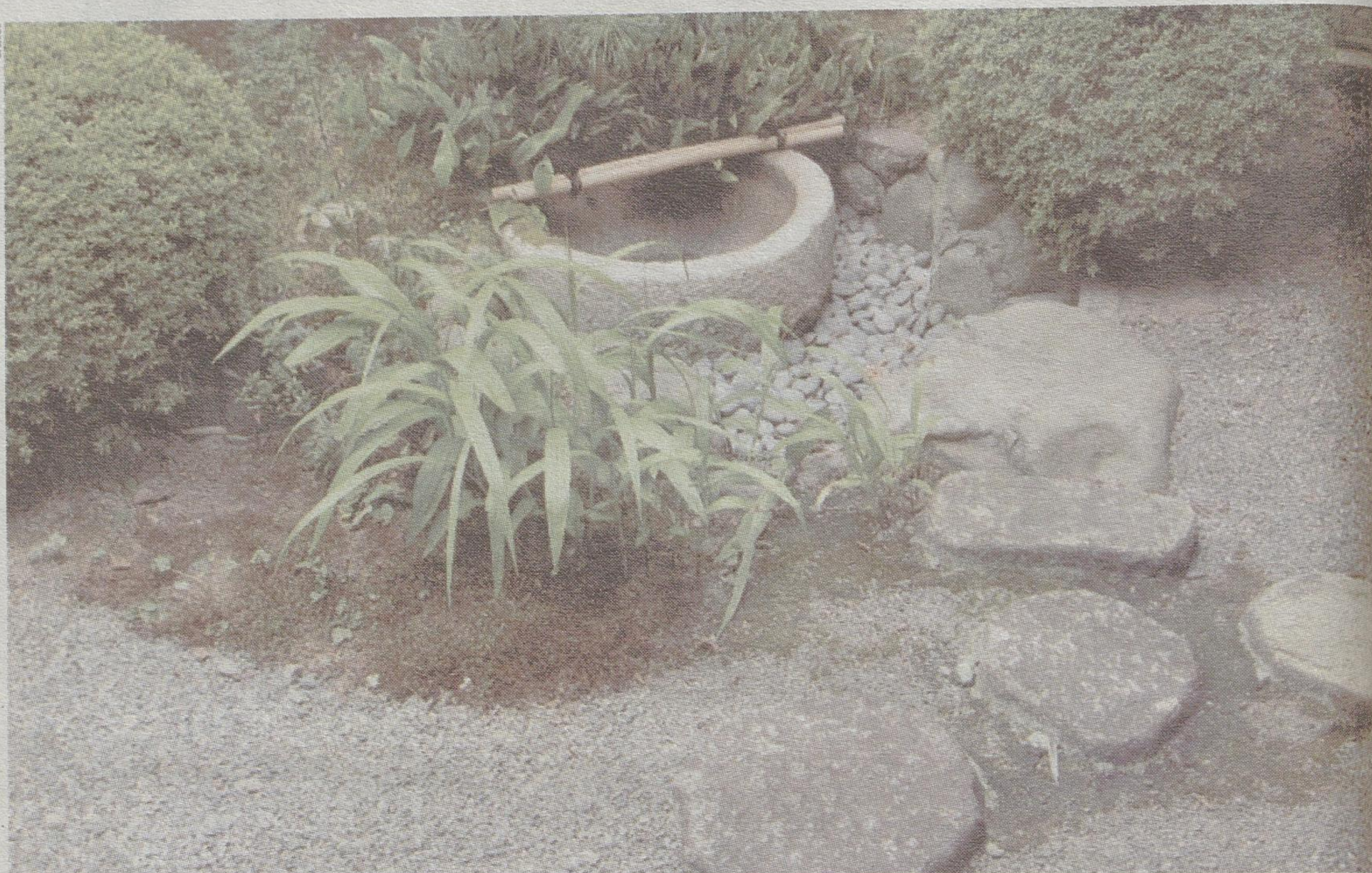
Bliskie naturze kolory – złamana zieleń, szarość i brąz

Tradycyjna wrażliwość japońska nakazuje okazywanie kamieniom szacunku, jako bytom obdarzonym duszą. Kamienie tworzą ścieżki i mostki. Ich skupiska złożone są