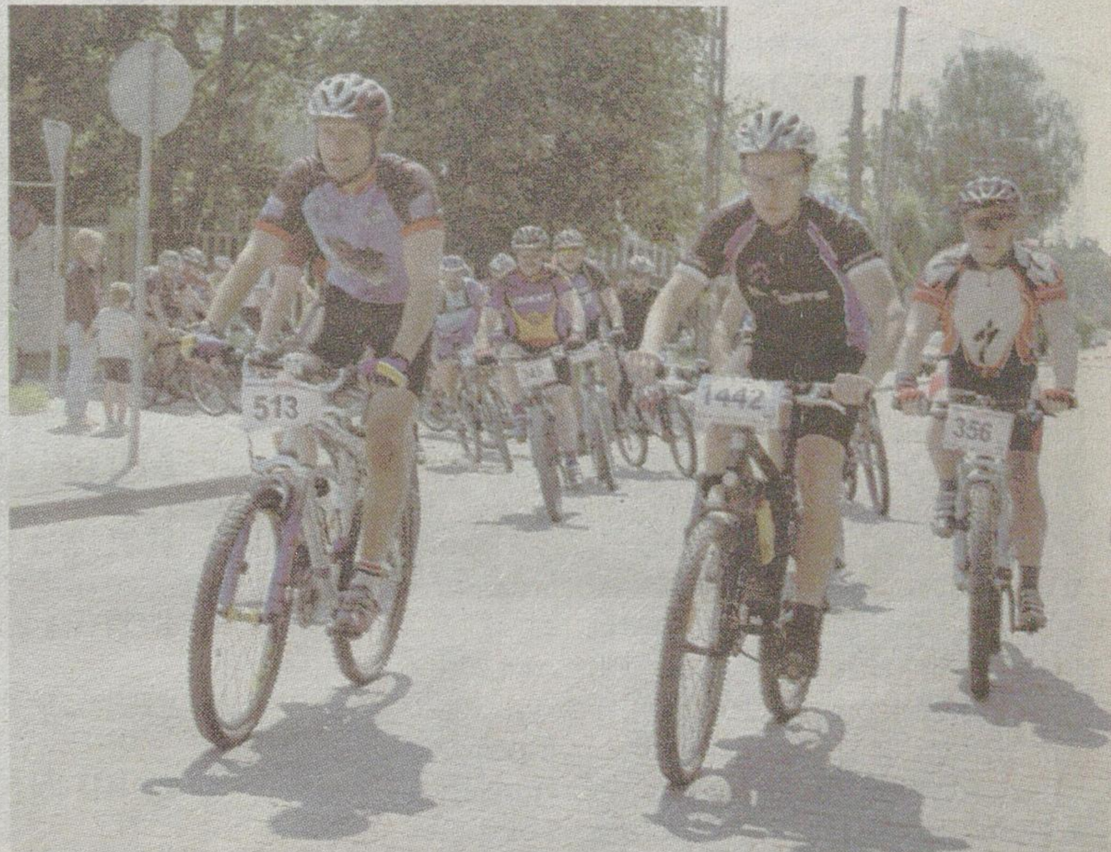
Ponad 500 miłośników kolarstwa górskiego z całej Polski wystartowało w sobotę w Mazovia MTB Maraton w Supraślu

– To był najpiękniejszy z dotychczas rozegranych wyścigów Mazovia MTB Maratonu w 2007 roku – twierdzili zgodnie uczestnicy zawodów w Supraślu. A zmagali się oni na pagórkowatych trasach w okolicach Królowego Mostu, Surążkowa i Podsupraśla. Jak wyliczono suma podjazdów na 60-kilometrowej trasie wyniosła ponad 600 metrów i ponad 900 metrów na dystansie 100 km. Prawie jak w górach! Tego nikt z rowerzystów z Warszawy się nie spodziewał i nie mogli się nachwalić. Korzystne opinie na temat imprezy pojawiły się na forach internetowych: „Górki wypas, jakby było ich więcej to chyba bym się wczłowił pod nie. Trasa mistrzowska... i te wioski jak z bajki.” „Supraśl wpisuje do kalendarza na stałe! Super trasa, połączenie gór i szybkich zjazdów. Cieszę się, że wybrałem Supraśl w ten weekend, a nie Kraków.