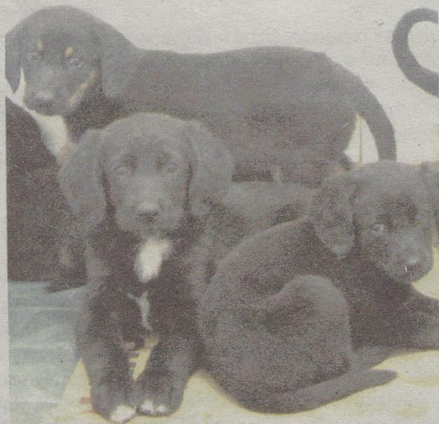
Trzy pieski i trzy suczki czekają na kogoś, kto je pokocha

Choć mają zaledwie 7 tygodni, wiele już wycierpiał. Przyszły na świat w ogródku działkowym i razem z matką, marząc i głodując, były przeganiane z miejsca na miejsce. Jeden szczeniak został otruty, drugiego potrafił samochód. Pozostałym szóstce groził podobny los. Teraz pieski czekają na nowy dom w lecznicy weterynaryjnej przy ul. Wesołej 18 w Białymstoku (tel. 085 742 38 00, 507 080 606).