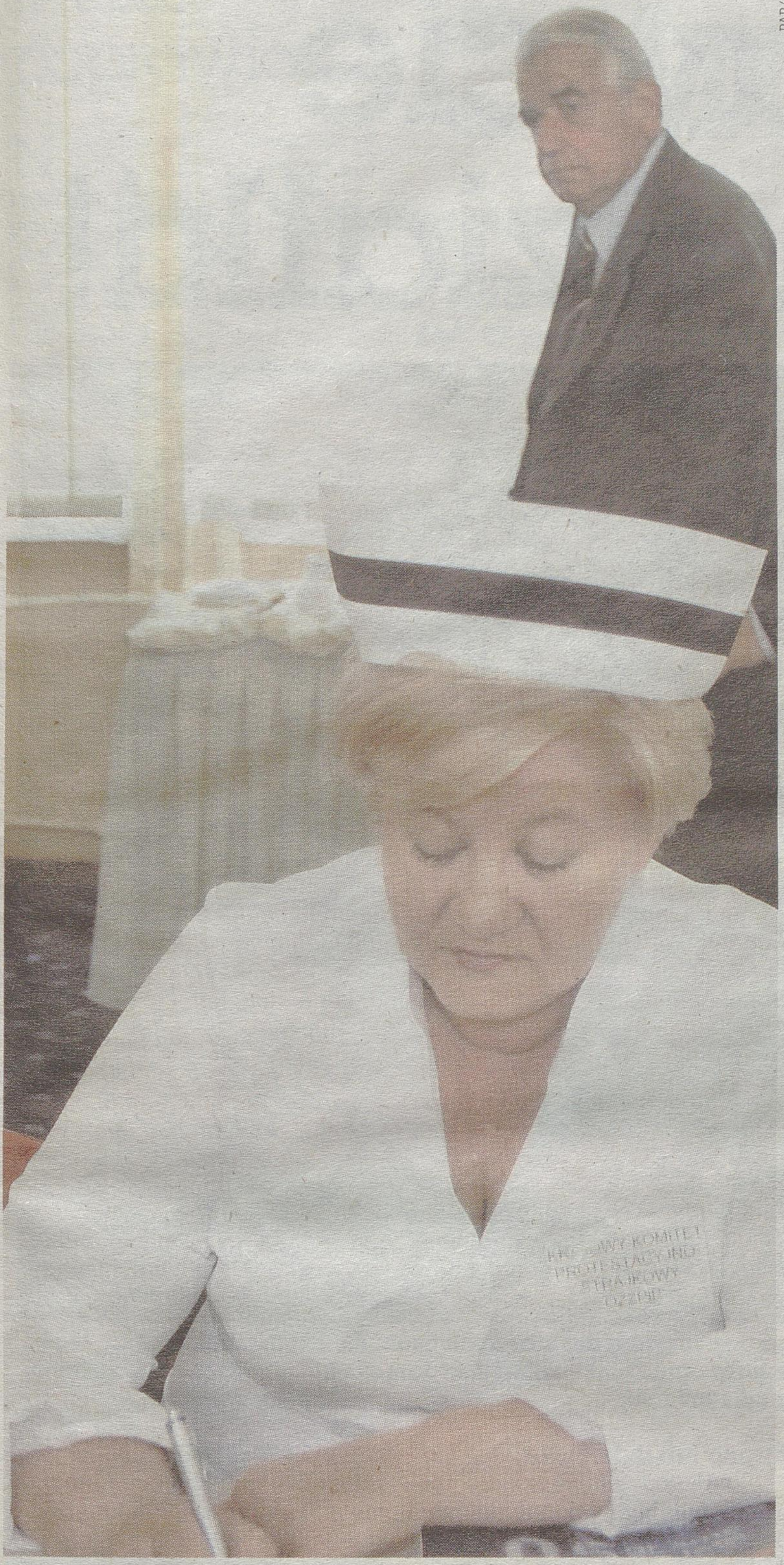
Wczorajsze spotkanie ministra zdrowia z przedstawicielami związków zawodowych nie przyniosło rozwiązania sporu

Z tzw. badań dendrochronologicznych wynika, że to gród w Gieczu (wieś między Poznaniem a Wrześnią), a nie w Gnieźnie był pierwszą siedzibą rodu Piastów. Dendrochronologia polega na odczytywaniu z przekroju drzewa daty jego ścięcia. Badania nie pozostawiają wątpliwości: gród w Gieczu zbudowano w latach 60. IX wieku – gród w Gnieźnie postawiono dopiero około 940 roku.