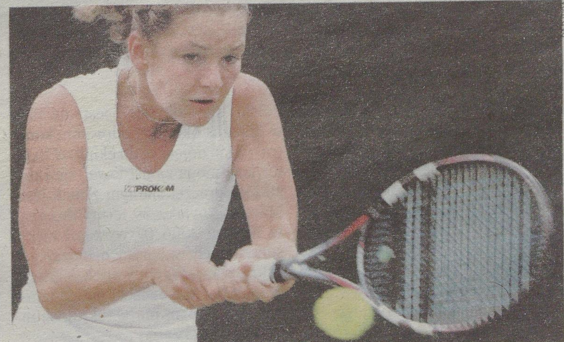
Agnieszka Radwańska gra już tylko w deblu i miksie