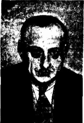
PRIMO DE RIVERA