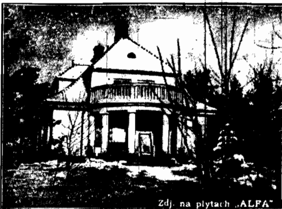
Zdj. na płytach „ALFA”