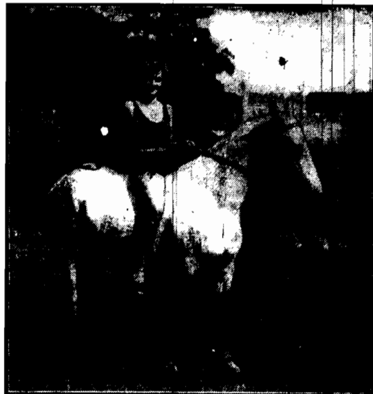
Jeszcze świeża rosa zalega trawnik parku, a już piękna pani zamyka wyjeżdża na ranny spacer na rasowym arable.