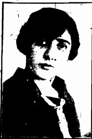
KSIĘŻNICZKA KUBRA, siostra żony króla Afganistanu, upa- trzoną na żonę dyktatora Turcji.