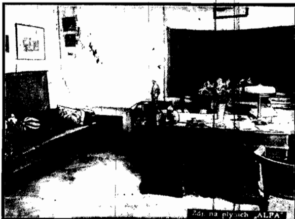
Gabinet pracy Marszałka Piłsudskiego.