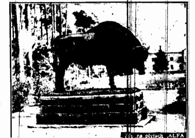
Wspaniały odlaw z brązu, wystarzony i miedzi, ustawiony w parku w Białej Górze.