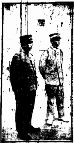
Yu-Ting i Chang Hsue-Liang przed kwatery głównej wojsk, które broniły Pekinu.