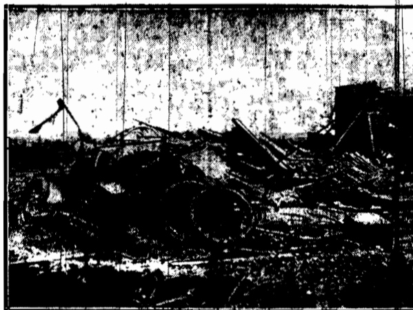
który przeszedł nad stanem Nebraska w Ameryce, pozostawiając za sobą jedynie gruzy i ruiny.