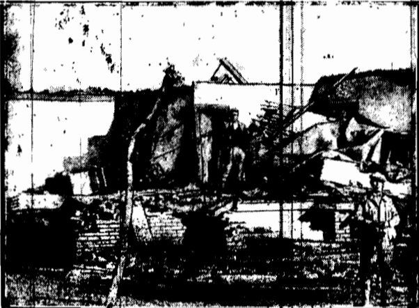
który przeszedł nad stanem Nebraska zniósł niemal z powierzchni ziemi miasteczko Mc Cook. Oto jeden ze zburzonych domów.