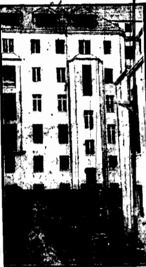
Na rogu ulic Nowogrodzkiej i Sładowskiej zbudowano gmach Banku Rolnego. Widok od podwórza.

mując się wydobyć cenny skarb. Stało się to możliwe dzięki wynalazkowi nowego przyrządu, który jest kombinacją prasy hydraulicznej i skafandra.