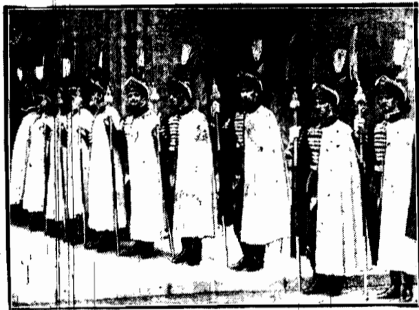
Przyboczna straż regenta Horthygo.