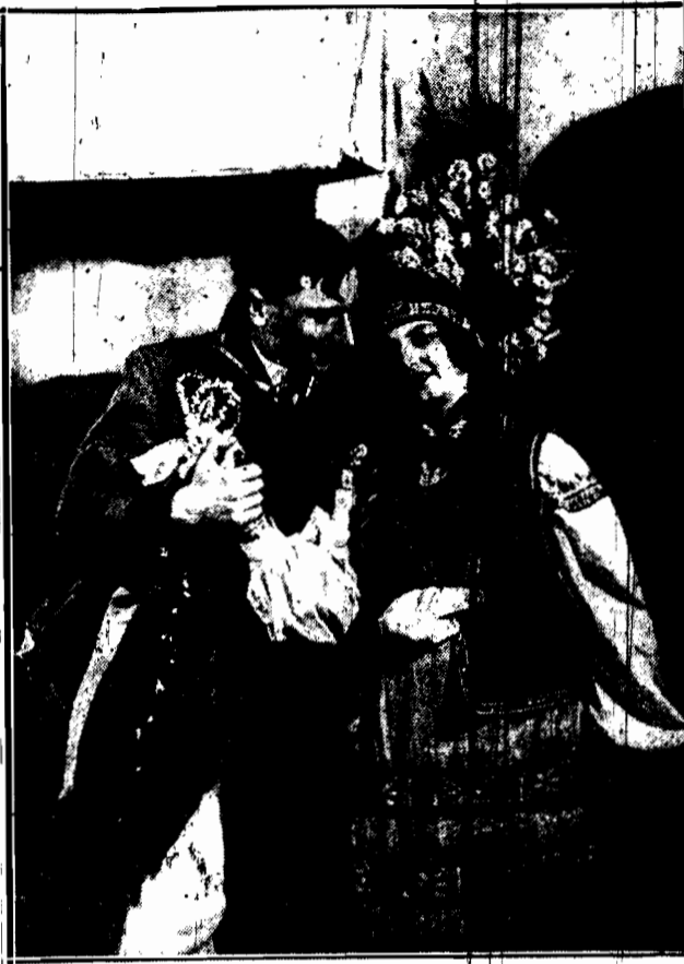
Para młodych Kurpiów w sztuce ks. Sklerkowskiego, granej obecnie w Warszawie.