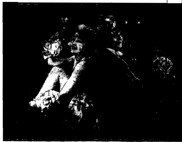
Nad ranem w dancingu. Po nieskończonych czerstonach należy chwile odopczuć, siada więc para tancerzy w „dartergo oda”, by po odopczynku i orzeźwieniu się ruszyć znowu w tan.