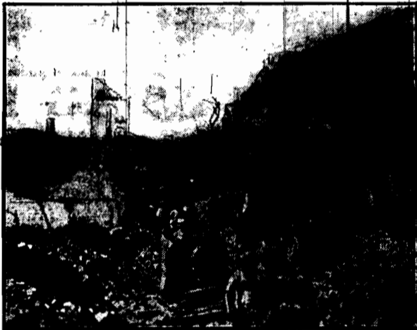
Szcząne skutki wojny domowej w Chinach: ruiny zombombardowanego w czasie ostatnich wałk Kantonu, jednego z największych miast chińskich.