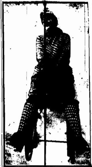
rozewia się coraz więcej, zwłaszcza w Spawacznicy, gdzie teren i klimat są pomyślnymi. Na zdjęciu amatorka jazdy saneczkowej w typowym kostiumie sportowym.