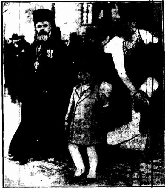
6-cioletni król rumuński Michał, pomimo tak młodego wieku, musi już wykonywać czynności reprezentacyjne. Na zdjęciu małejki władca wychodzący w towarzystwie matki, ks. Heleny, i regenta partyarchy Mirona Chrystea z noworocznego nabożeństwa w katedrze w Bukareszcie.