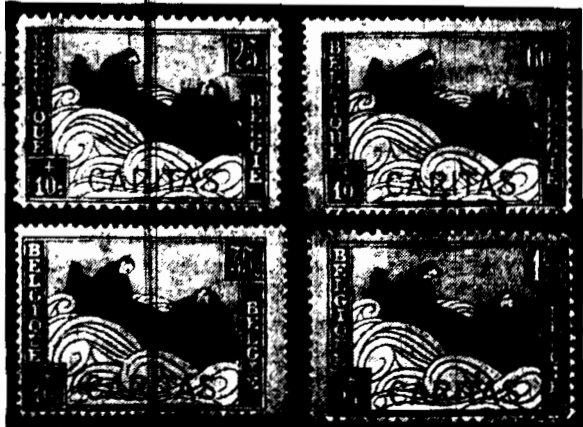
Poczta belgijska wydała obecnie nowe marki na zastosoowanie rozbitków żydowskich.