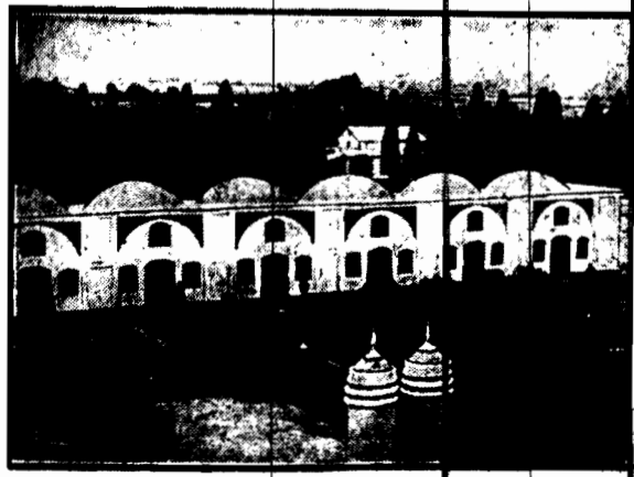
Tak wygląda zimowa siedziba emira afgańskiego, odbywającego obecnie podróź po Europie. Na lato emir wraz z rządem udaje się w горы, by usiąść do górczych upałów, pomagających na szlakach.