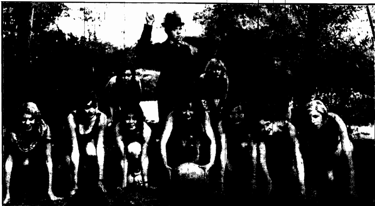
Wytwórnia filmowa First National nasświetla obecnie wielki film sportowy z znanym artystą Harriem Longdenem w głównych rolach.