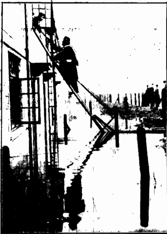
W spektakle nagler stawał po znacznych opadach śniegowych, część Anglii ulega katastrofalnej powodzi, która zalała wiele wsi i miast. Na zdjęciu dorecentnie powodzi w zalanym mieście Stonebridge.