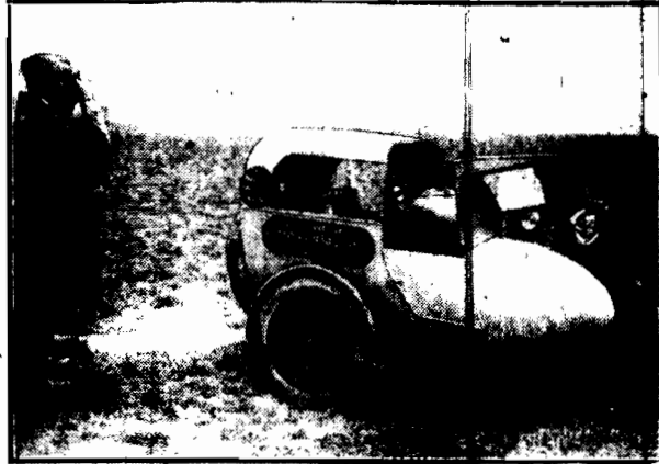
podczas prób technicznych na lotnisku.