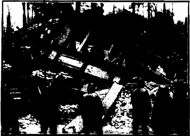
W laboratorium chemicznym, mieszczącym się przy ulicy Parkstrasse 40 w Berlinie, nastąpił wybuch. Wylał ulegał zupełnemu zniszczeniu. Pod tej gruzami 2 osoby znalazły śmierć, 8 zaś odniosło ciężkie rany.