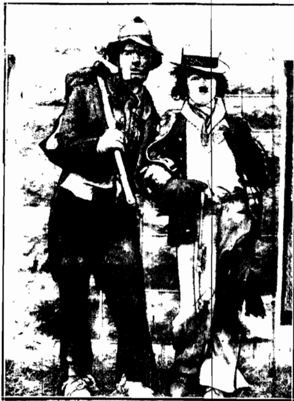
tu studenci uniwersytetu w Kansas (Stany Zjednoczone), którzy na dorocznym konkursie kostiumów uzyskali pierwszą nagrodę za tak pomysłowe kostiumy włóczęgów.