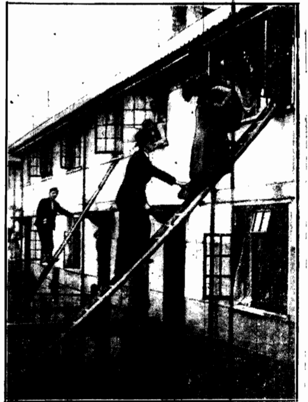
W jednym z miasteczek w nawiedzonym przez powódź hrabstwa w Anglii wchłodniej w ten sposób „ewakuowano” ze szkoły pensionarki, które powódź przytapała w szkole.