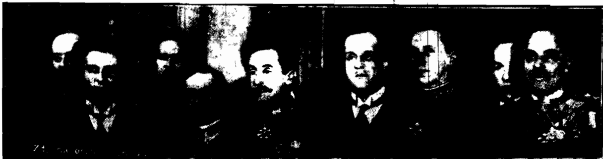
Na zdjęciu p. Erdine wreczył p. Prezydentowi Rzeczypospolitej listy uwierzyteliwujące. Na zdjęciu p. Erdine i szef protokołu Przedstawicielstwa w otoczeniu członków poselstwa i domu cywilnego i wojskowego p. Prezydenta.