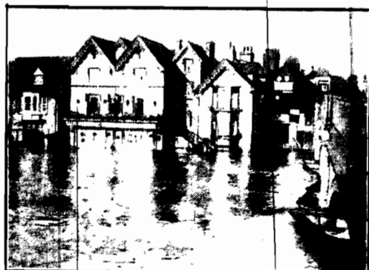
Niebywale śnieżyce, a po nich odwilż, wywołały w wielkiej polaci Anglii powódź. Tak wygląda jeden z placów w Windsorze, położony nad Tamzą.