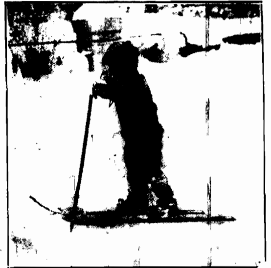
Pierwsze kroki na nartach są trudne dla każdego wieku, młodzież jednak trudności pokonywa najłatwiej, nie zraża się niepowodzeniami i co krok bliżej jest do doskonałości.