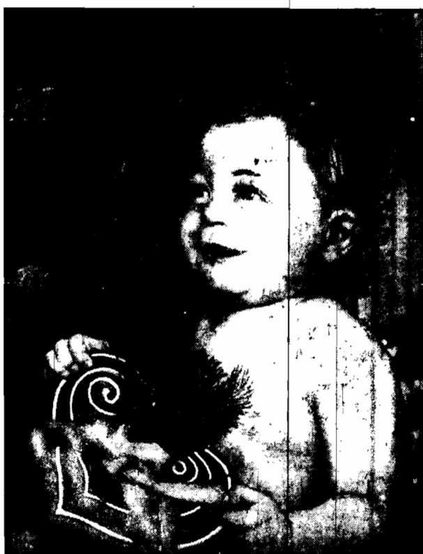
po wykosowaniu tradycyjnego piernika z ukrytą w nim godnością.

a więc: za wodę, wywóz nieczystości, czyszczenie przewodów kominiowych, za wynagrodzenie dozorczy. Z chwilą, gdy komorne przekroczy 50 proc., a więc przypuszczalnie w III kwartale r. bież. — świadczenia wygasają, z wyjątkiem wydatków na wodę, za którą pobierana będzie opłata do chwili przekroczenia 75 proc. normy.