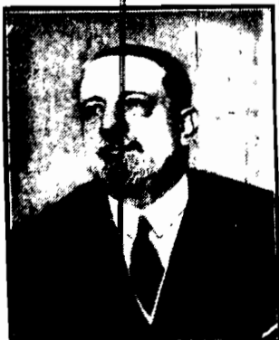
Włoski minister skarbu hr. Volpi wystąpił z zamiarem wprowadzenia we Włoszech waluty złota.