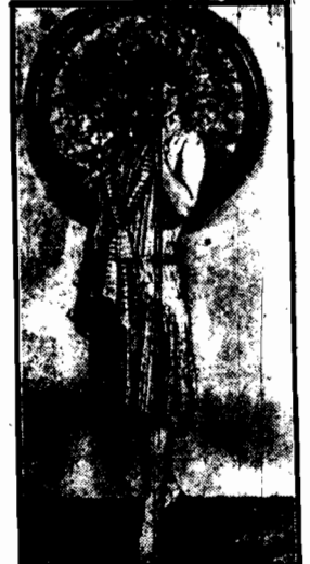
tuż ukazują się w zagranicznych gazetach mody. Oto wzór skromnej, a gustownej sukni wiosennej.