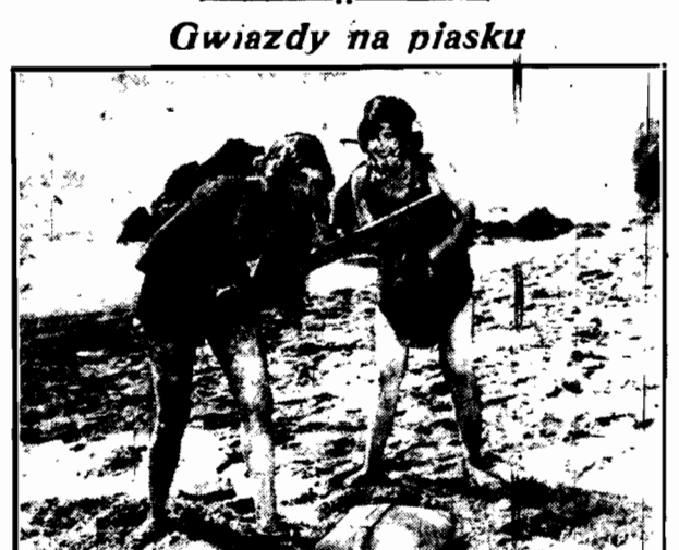
Dwie prawdziwe gwiazdy filmowe, Baby Ruth i Doris May podczas wyścigu na plaży amerykańskiej.