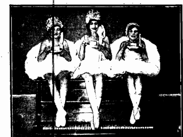
Nadobne tancerki, usadowiwszy się na pianinie, pokrzepiają się filiżanką herbaty.