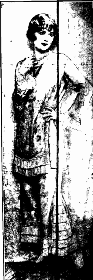
W sukienka imitująca spodenki, aby łatwiej było chłopczyce odróżnić od chłopca.