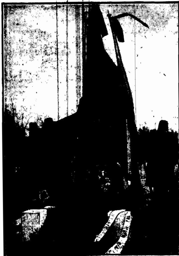
W niebiańskim na cmentarzu warszawskim odbyła się uroczystość uczczenia pamięci poległych w wojnie światowej, która odbyła się przy śpiewaniu walców z żołnierskimi.