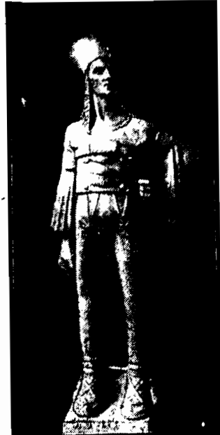
Rzeźba Józefa Jasńskiego, zakupiona przez Warszaw. Zachęty Sztuk Pięknych na doroczne losowanie.

ni młodzieńca uczenicę Morfit Parker, żądając od rodziców wykupu w kwocie 1500 dolarów.