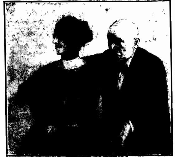
znakomitego dramaturga, k. p. Stanislaw Przybyszewskiego, wraz z małżonką. Zdjęcie zrobione podczas ostatniego pobytu zgałego artysty w Zakopanem.