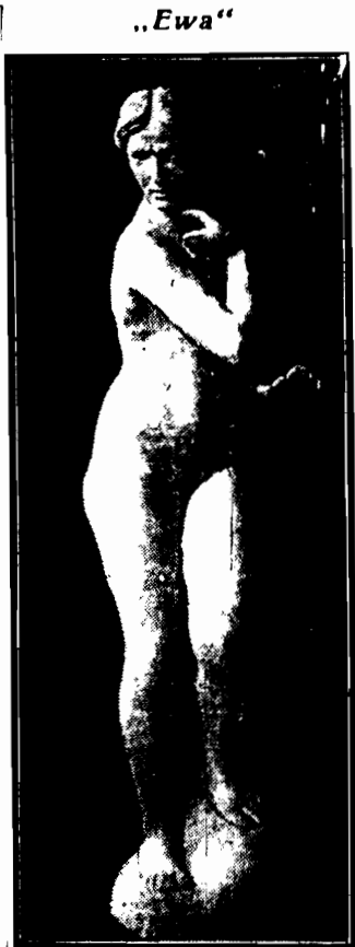
„Ewa” RZEZBA JÓZEPA JASIŃSKIEGO zakupiona przez Warszawskie Tow. Zachęty na doroczne losowanie