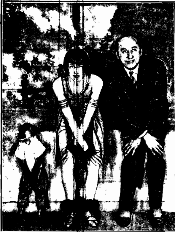
Małpa-pawian nauczyła się nader szybko charlestona wraz z wszystkimi skomplikowanymi figurami i uczestniczy w popisach tanecznych swych właścicieli