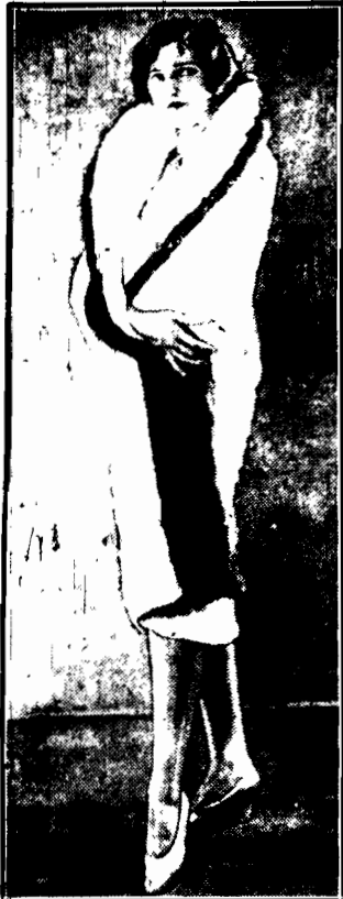
Jasnego, zwykle białego futra, ozdobionego innem, ciemnem. Jest to rodzaj t. zw. sortie de bal.