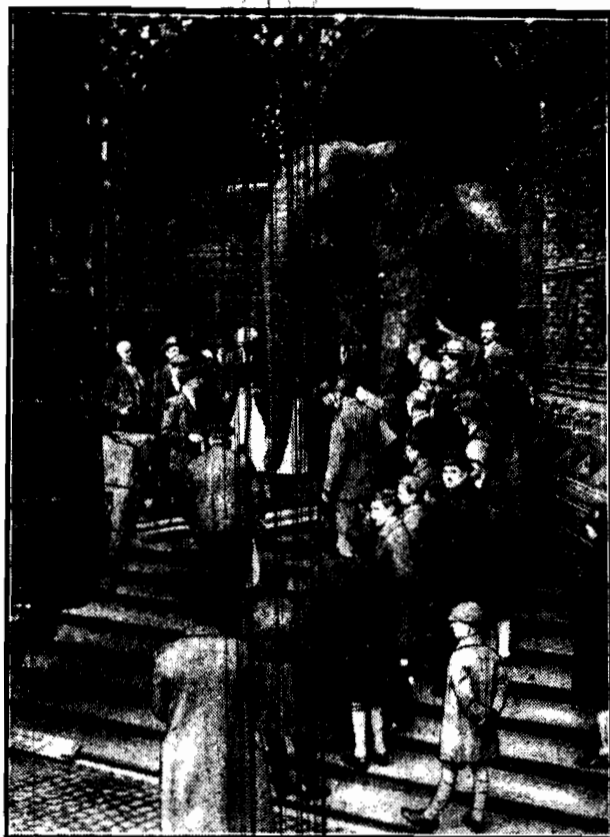
Niezwykle wielkich rozmiarów okaz słonia afrykańskiego powiększył zbiory angielskiego Muzeum Historii Naturalnej