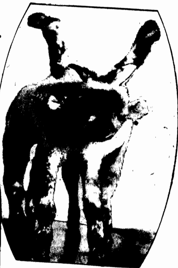
CO TO JEST? Szczególny wybrzyk natury: lama urodzona gdzieś w Peru, licząc widocznie na odbywanie dalekich kursów, zaopatrzyła się przeczornie, aż w cztery pary nóg, przychem czwartą „zapasową” parę umieszcila sobie na grzbiecie. Nie używała jednak długo „asortymentu” kończyn, bowiem w parę godzin po przyjęciu na świat — zdechła.

Na stanowisko przewodniczącego Mędzynarodowego Trybunału Sprawiedliwości obrano przedstawiciela Włoch, Anzilottiego.