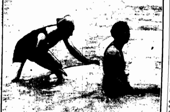
NIECO ZIMNA KAPIEL. Nowy zupełnie sport — nagocci podczas mrozu. Na zdjęciu dwie zwolenniczki tego sportu biorą kąpiel w rzece, polarywej kra.