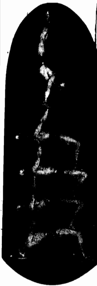
PIRAMIDA LUDZKA. Goszcząca obecnie w Berlinie rosyjska trupa akrobaticzna Baranowów, wzbudza sensację swemi popisami. Oto jeden z najlepszych numerów trupy — piramida pięciopiętrowa.

Strajk australijskich robotników portowych i okrętowych zlikwidowano dziś rano.