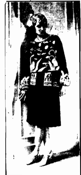
Jedną z ostatnich kreacji paryskich, suknia wizytowa czarna, ozdobiona białymi aplikacjami.