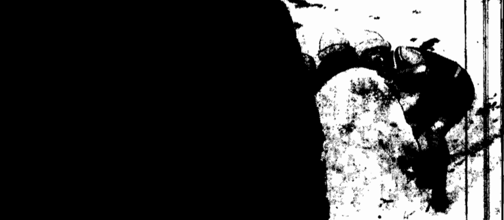
WISTE DAMY. W czasie wycieczki w o temperaturze znacznie wyższej niż w czasie wycieczki, kobiety w lekkich kostjumach bawiły się na śniegu.