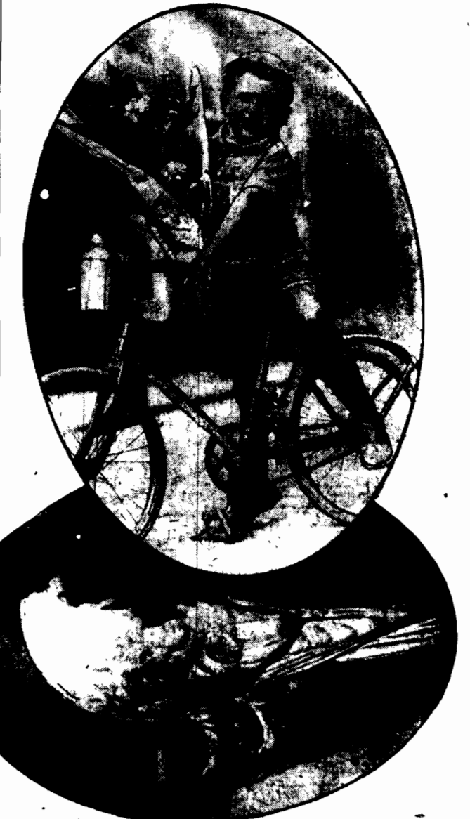
GOLAB O CZTERECH NÓŻKACH W jednym z gołębników berlińskich znajduje się ciekawy okaz, wzbryk nazywany golab o czterech nóżkach.

— Statystyki wykazują malejące ilości samobójstw w Japonii. 2.000 osób zginęło w roku ubiegłym pod pociążami. Celem wypełnienia tej płaci zastosoowano specjalne urządzenia hamulcowe w pociągach.