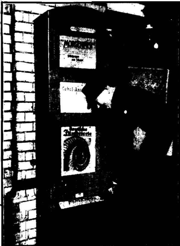
Automat na ulicach Berlina