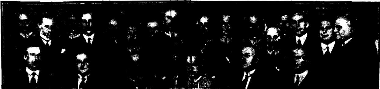
Marszałek Piłsudski wydat w środe śniadanie w kasynie oficerskiej na cześć opuszczającego szeregi armii gen. Żeligowskiego. W śniadaniu wzięli udział członkowie rządu i generalicja. Marszałek Piłsudski w serdecznych słowach żegnał gen. Żeligowskiego, podnosząc jego zasługi, umiłowanie honoru i służby. Następnie gen. Żeligowski zapewniał, iż sercem pozostanie na zawsze wśród wojska.