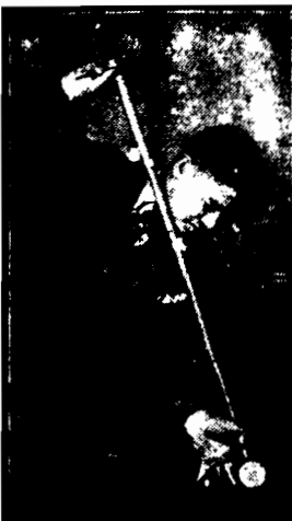
Dotychczasowy król bilardu, Amerykanin Cochran, zwyciężczy na konkursie w Chicago Niemca Hagenlocha, otrzymał piśmiotwany dotychczas tytuł króla bilardu.