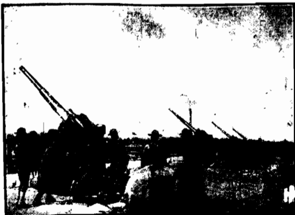
W miejscowości Aberdeen w stanie Maryland dokonywano prób z nowego systemu działami żenitowymi, brojącymi przed atakami samolotów.