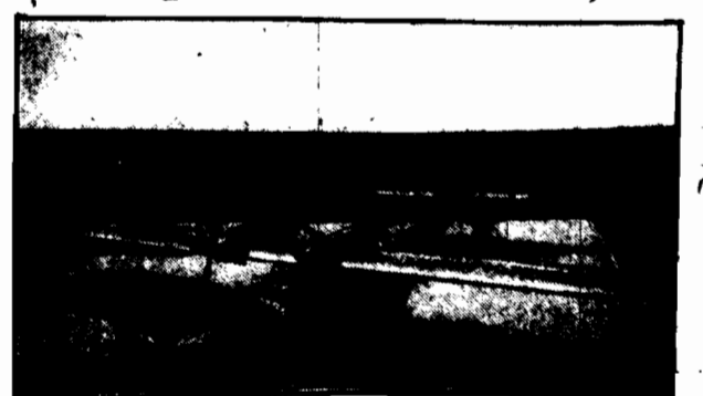
Model czteromotorowego slizowca, wynalazku inżyniera niemieckiego, Slizowiec taki, zaopatrzony w cztery śmigła, będzie mógł odbywać podróż przez ocean.