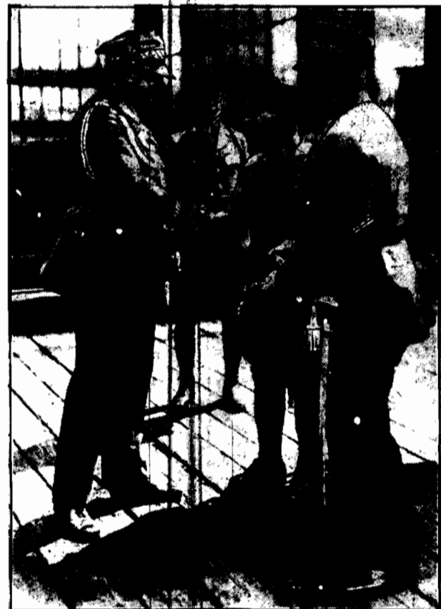
Przebywający w Ameryce na kongresie chirurgów wojskowych szef polskiego sanitariatu wojsk. gen. Rouppert zagadnięty został jakiegoś kaprala armii amerykańskiej, który go powitał w języku polskim. Jest to syn emigranta polskiego. General serdecznie uściślał rodaka.