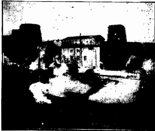
W mieście Volterra we Włoszech wybudowano wielką elektrownię, w której maszyny wprowadzą w ruch parę i gaz pochodzący z wulkanicznego, wydobywającego się z ziemi. Elektrownia ta zaopatruje w energię szereg miejscowości położonych w promieniu 100 kilometrów od Voltery.