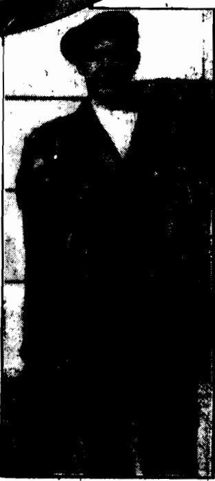
DO SZERĘGU, POD BRONI!