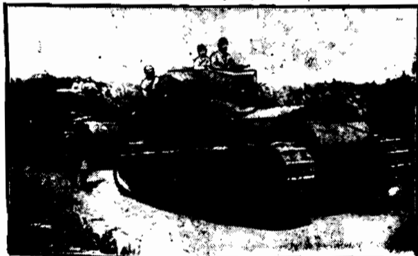
W połowie września odbyły się wielkie manewry armji japońskiej w okolicach szanego wulkanu Fujiama. Na zdjęciu czołgi japońskie najnowszego typu.