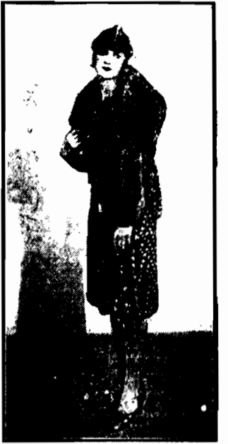
Jesenny kostjum spacerowy. Jako uzupełnienie piękna etola futrzana. Z „Akademii mody” w hotelu „Polonia”.