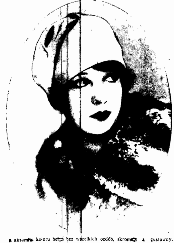
W aksambu koloru bez bez wszelkich ozdób, skromny i gustowny.

Zdobywane przez placówkę zagraniczną informacje, mają oczywiście wpływ na politykę danego państwa, a tem samem na stosunki międzynarodowe. Lecz dyplomaci są krepowani rozmaitemi względami, brak im zupełnej swobody ruchów i to uzależnia ich od usług informatorów.