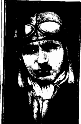
Lotnik francuski Costes po szczęśliwym odbyciu lotu nad Atlantykiem wylądował w Portu Natal w Brazylii.