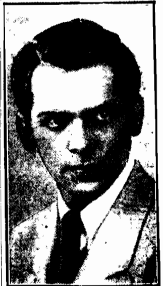
Nowa siła artystyczna firmy „First National”. Warunki zewnętrzne pierwszorzędne. Czy dorówna sławie wielkiego Douglasa?