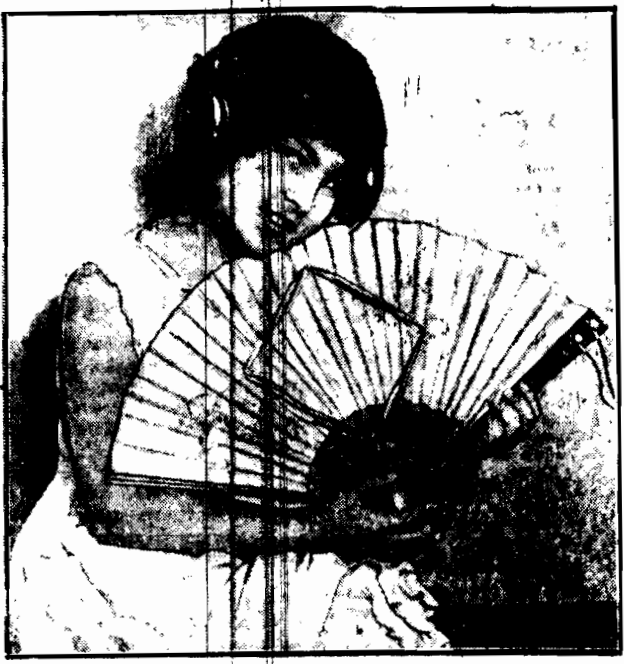
Najnowszy wynalazek w dziedzinie radia: mały aparat kryształkowy wraz z anteną umieszczony w wachlarzu. W przerwach między bluesem a black-bottomem tancerki nadobne mogą słuchać programu.