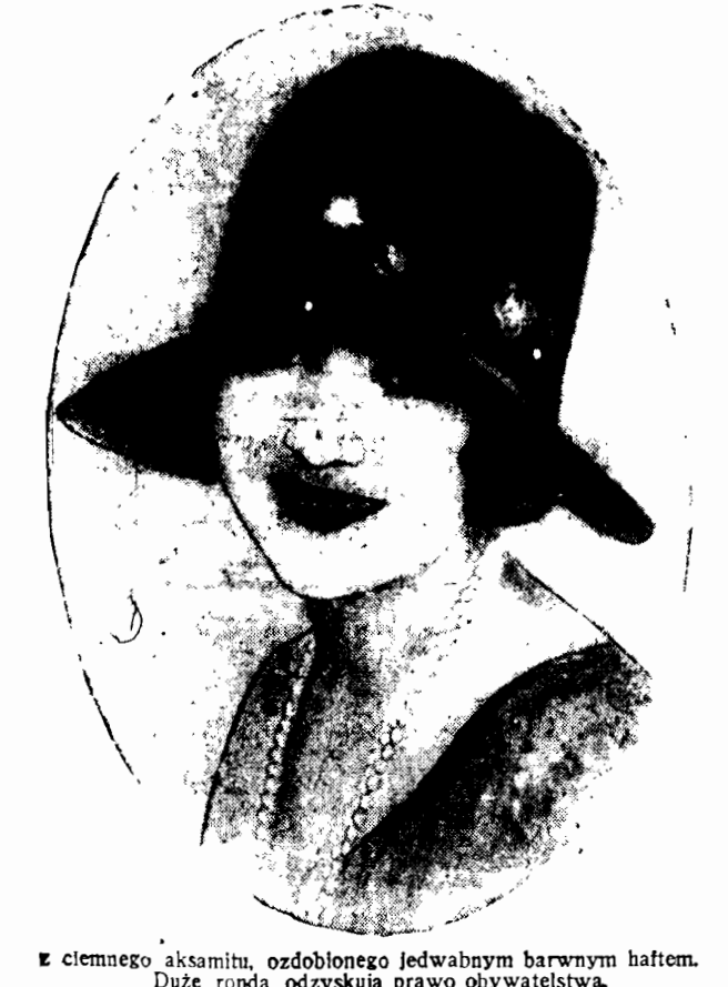
Z ciemnego aksamitu, ozdobionego jedwabnym barwnym haftem. Duże rondo odzyskują prawo obywatelstwa.