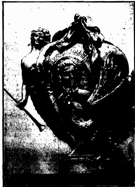
Urna, w której z górą wiek spoczywało serce największego z bohaterów narodowych Tadeusza Kościuszki w muzeum w Rapperswilu.