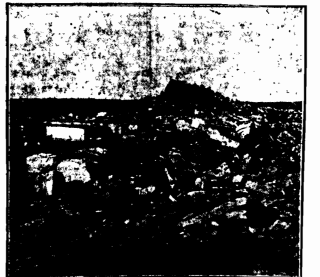
Ruiny fabryki granatów w Lützenburger Heide pod Hanowerem, zburzonej przez Niemców na żądanie komisji rozbrojenkowej. Czyżby istotnie Niemcy się rozbrajali?