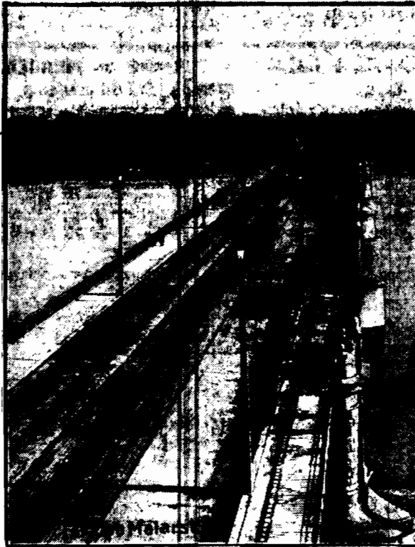
Most ks. Józefa Poniatowskiego, całkowicie odbudowany w 12 lat po zburzeniu przez Moskali.