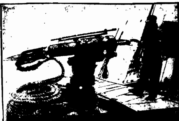
Stalki wielorybiczne zaopatrzone bywają obecnie w specjalne działki, wyrzucające na wielką odległość harpuny.