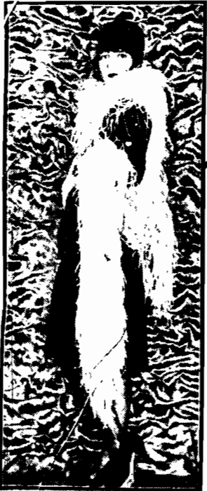
z czarnego aksamitu. Jako uzupełnienie wstędy boa ze strusich piór. Do zdjęcia pozowała jedna z coraz liczniejszych plejadi gwiazd filmowych Louisa Brooks.