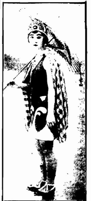
Młoda Japonka uznana na jednej z plaż w ojczyźnie swojej za typ piękności japońskiej.