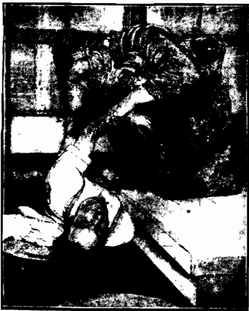
Książka wyszła w armji, górnictwie i straży ogniowej nowe maski przeciwgazowe. Na zdjęciu górnik, zaopatrzony w maskę ratuje koleżkę zatrutego gazem.