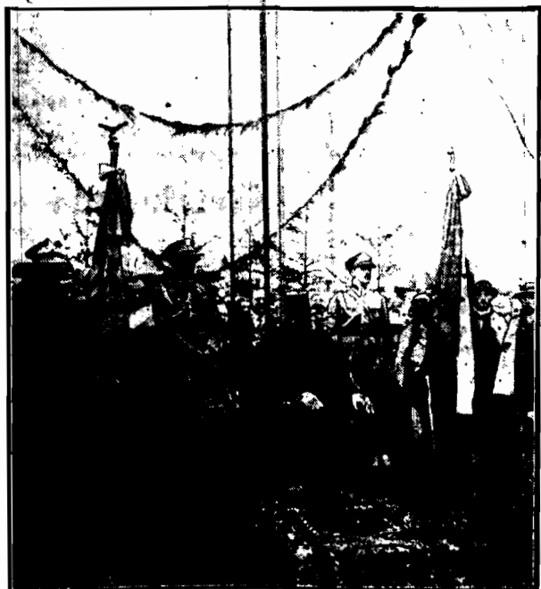
w czasie doświadczenia na Błoniach