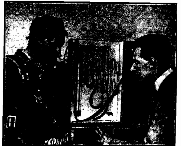
W Londynie są obecnie dokonywane próby z nowymi maskami przeciwgazowymi, które znajdują zastosowanie nie tylko w armji, lecz i w górnictwie i w strażach ogniowej.