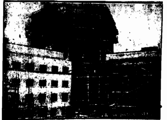
Przy ulicy Kopernika Nr. 12 wyrósł olbrzymi gmach, w którym mieszkać będą Państwo. Zakład ubezpieczeń od wypadków. Zdjęcie gmachu od strony dziedzińca.