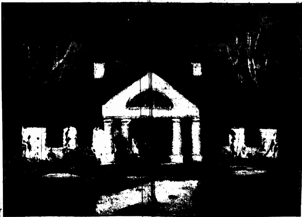
Mł. B. RYCHTER - JANOWSKA.