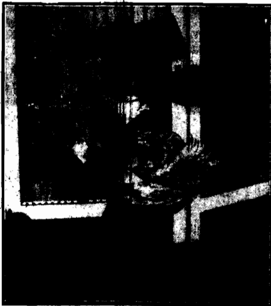
W jednym z kabaretów berlińskich wielkiem powodzeniem cieszą się występy psa zonglującego cylindrami