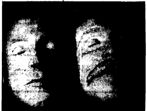
Po straceniu na krześle elektrycznym stworzył Sacco i Vanzettiego zbrodniczy maski gipsowe, wierne oddające rysy obuwia straconych.