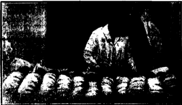
Stany Zjednoczone są krajem o znacznym stałym przyroście ludności. Oto pionierzy w jednym z przysiółków dla matek w Nowym Jorku.