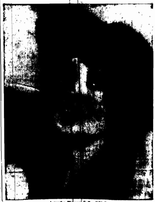
Artyści Młodości. Szt.: O'Neil.

Tajna organizacja ukraińska przez 5 lat mordowała dygnitarzy sowieckich RYGA. 26.9. Organy G. P. U. w Bedyczowie zlikwidowały organizację terrorystyczną, która działała od kilku miesięcy na terenie Ukrainy, mordując wyższych urzędników sowieckich. Organizacja składała się z 70 osób i w ciągu pięcioletniego istnienia zamordowała 56 wyższych urzędników sowieckich.