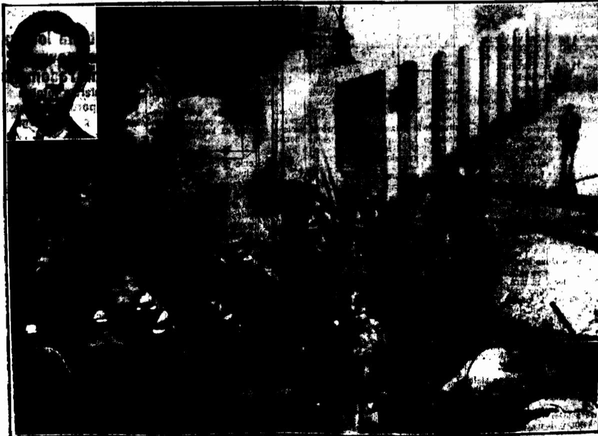
Strzał ostrożny w toku akcji ratunkowej. U góry — straszący Feliks Lewin, u dołu — zabity lekarz Łankoszki.