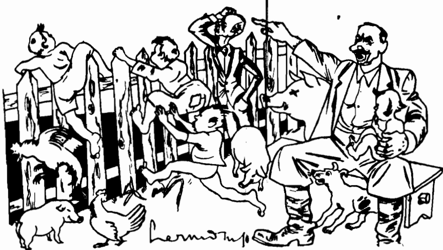
Ojciec Wincenty uczył dzieci swoje: Hejże dzieci, hejże ha, róbcie to, co i ja...