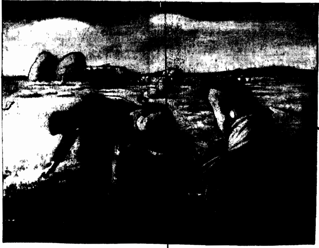
Malował JAN MILLET.

WIEN, 23.7. — Tel. wł. — Rada miejska Wiednia odrzuciła wniosek chrześcijańsko-socjalnych radnych, którzy zażądali rozwiązania milicji miejskiej (straż gminna), powołanej do życia podczas rozruchów.