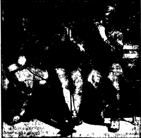
na małych harmonijkach