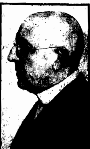
Szef rządu austriackiego ks. I. SEIPEL

się przeciw Burgtheatru strzelała policja salwami do tłumu. W samym parlamencie znaleziono 12 zabitych. Komunikacja telefoniczna Próby nawiązania komunikacji telefonicznej Budapesztu z Wiedniem spełziły na niczym. Wczoraj rano można było tylko otrzymać połączenie z Semmeringiem natomiast od godz. 10 rano wszelka komunikacja telefoniczna z Austrią została przerwana.