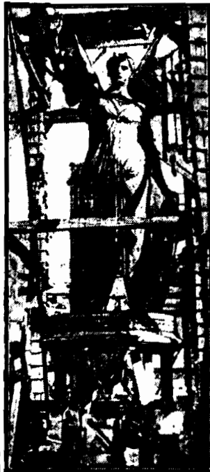
podstawiony z inicjatywy Mussoliniego wita przechodniów pozdrowieniem faszystowskim.