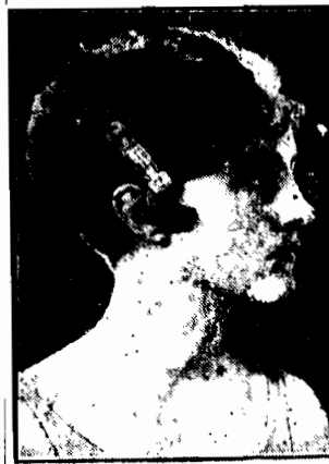
Jako przybrane głowy jest najnowszym bieżnikiem mody w Ameryce.