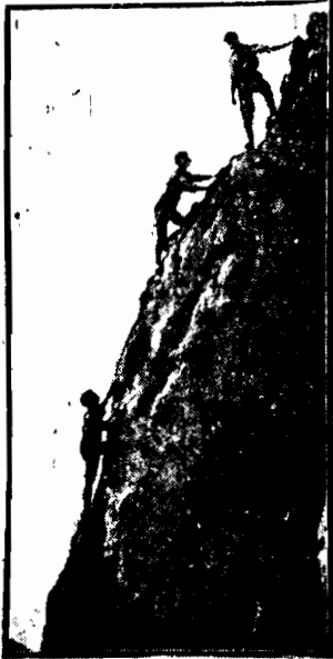
Trzej nieustraszeni alpinisci wspinają się na jeden ze szczytów w Alpach tyrolskich.