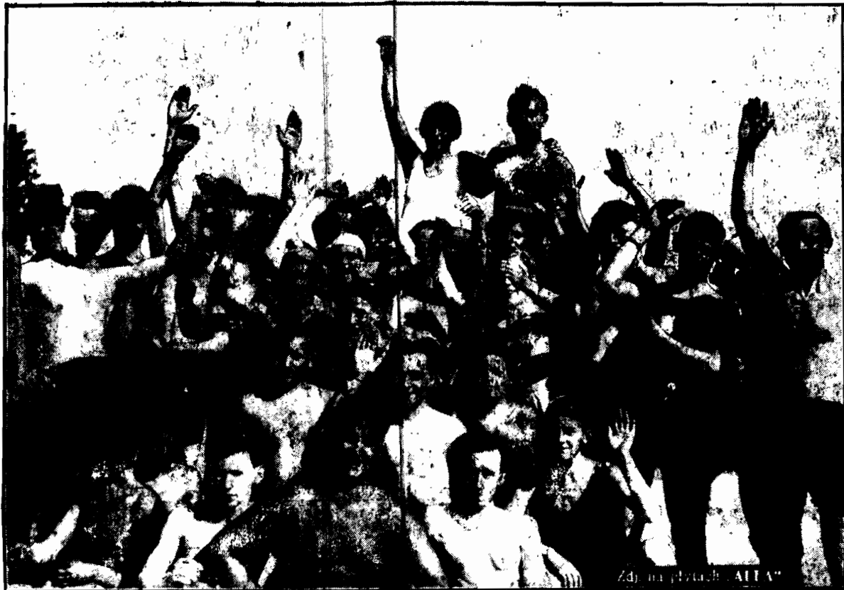
OBRAZEK Z PLAŻY WARSZAWSKIEJ