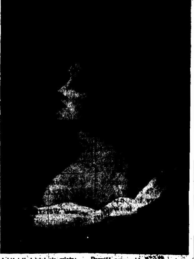
Jakis ból dzisiaj nie miota: W oczach widnieje tęsknota. Spleniona wcięty kaskada Na śniegi ramion jej spada.