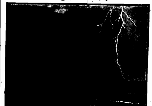
Zdjęcie dokonane podczas ostatniej burzy na lotnisku pod Krakowem.