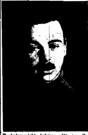
B. bolszewicki dyktator Wegier, Bela Kun, zwariował i jest zamknięty w szpitalu obłąkanych.