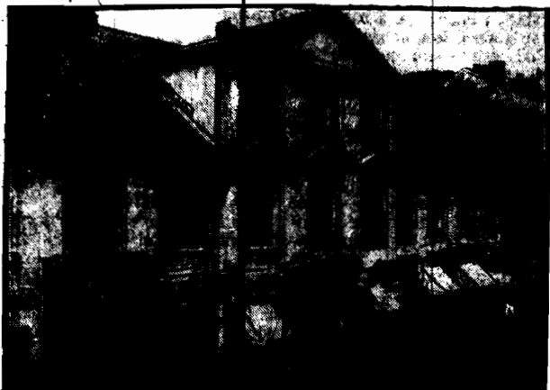
Dom nr. 20 przy ul. Elektoralnej w Warszawie.