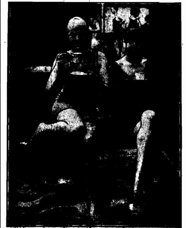
Tam na plaży słońce parzy, barwne plamy tworzą damy, piłą kawę w pewnym czasie, lecz się plotka każda pasie.