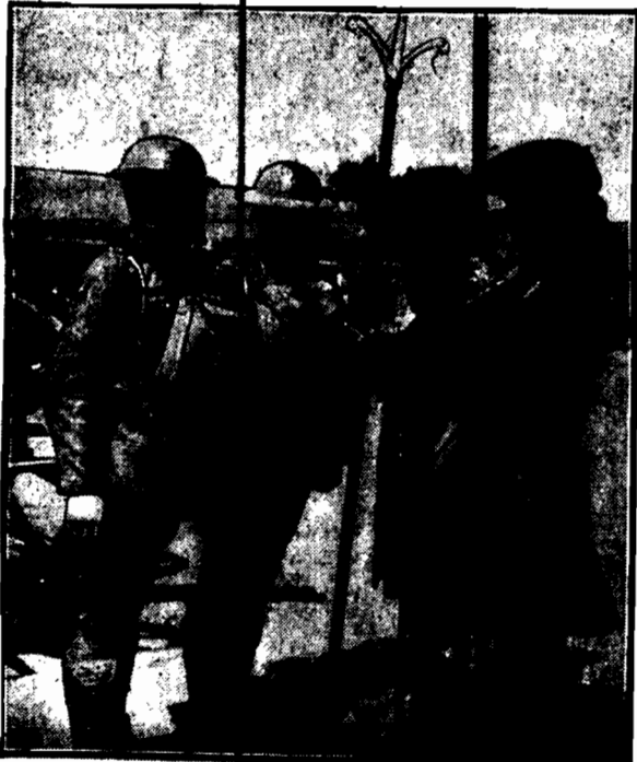
Obecnie i dawne umundurowane żołnierzy artylerji angielskiej, demonstrowane w czasie święta pułkowego w Aldershot.