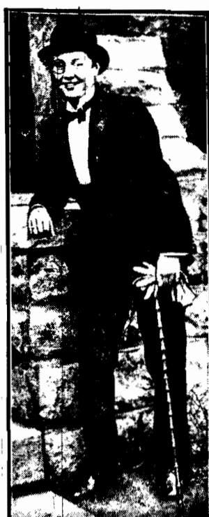
Dziewczyna — studentka uniwersytetu w Kansas (Stany Zjednoczone).