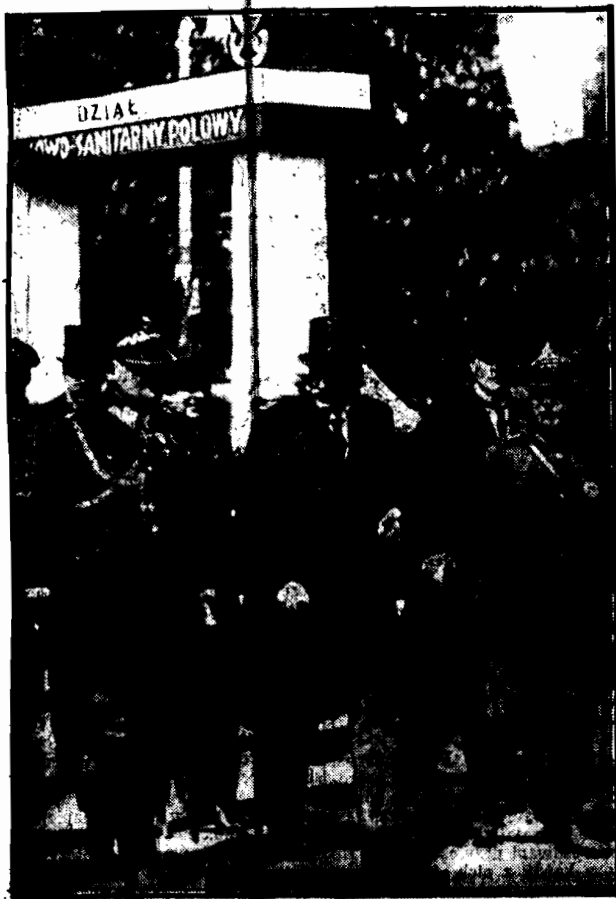
Prezydent Mościcki zaledziac wystawie opuszcza teren dzialu wojskowego. Powarzysto mu: przewodniczący kongresu gen. Roupert, tudzież przez komitetu wystawy em. gen. Horodyński i wiceprezes pułk. Krupnicki