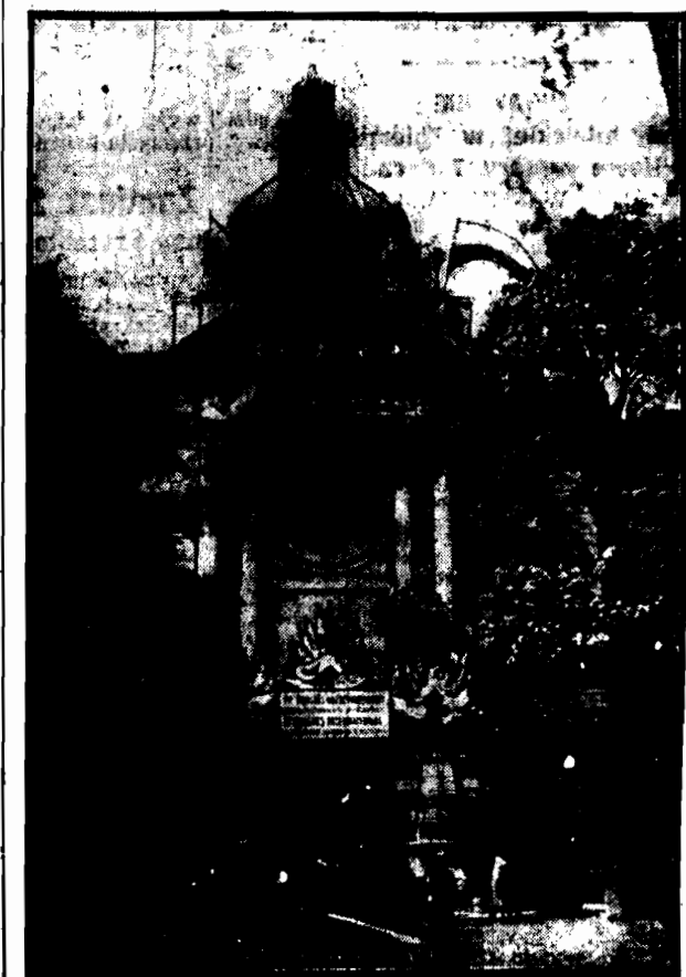
Ołóżkę wyjechał do smachu b. Podchorążówki, ozdobione sztandarami państw, biorących udział w kongresie.