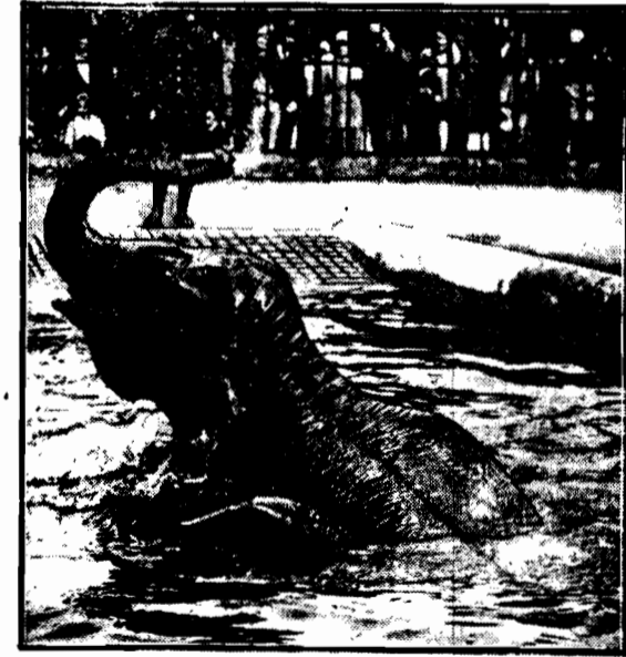
Stoń Jumbo w londyńskim ogrodzie zoologicznym bierze kąpiel poranną pod okiem dozorca.