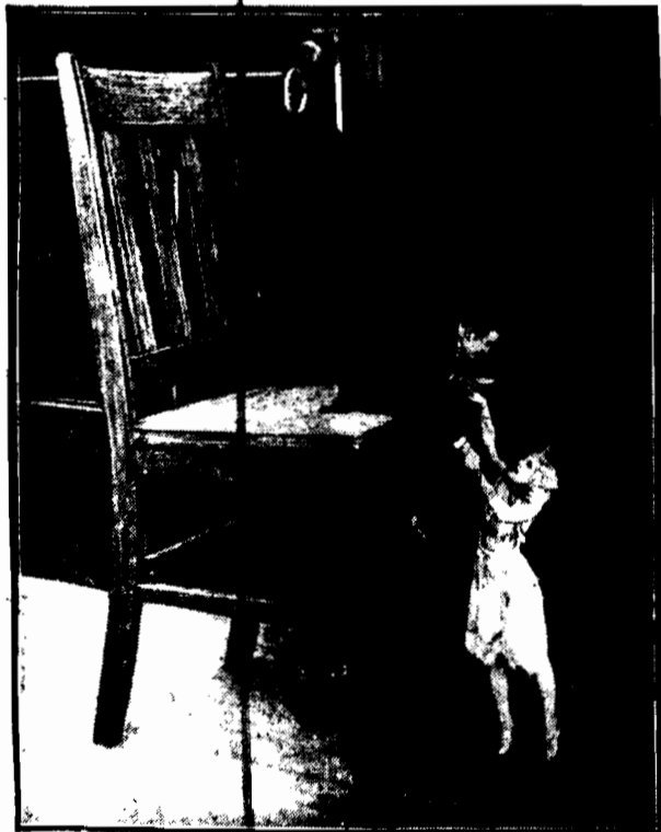
Lilipaci mówią są ludźmi wzrostu normalnego. Jedyne wyolbrzymione przy pomocy sztuczki fotograficznej meble i urządzenia wewnątrz sprawia, iż wydają się liliputami.