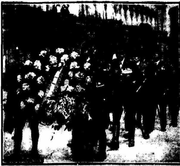
składa osobny wieniec na grobie Nieznanego Żołnierza.