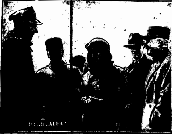
Enakomity lotnik francuski por. Thoret na lotnisku warszawskim w otoczeniu oficerów polskich i francuskich.