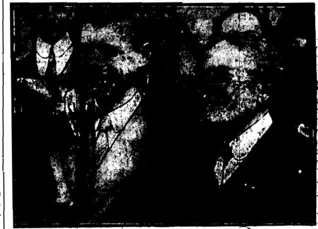
Kapitan Lindbergh sfotografowany z ambasadorem amerykańskim w Paryżu zaraz po wylądowaniu.