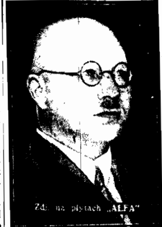
P. OTTO STRANDMAN nowy poseł estoński przy rządzie polskim, przybył do Warszawy i wkrótce obejmie urzędowanie.

z płonącego samolotu wyskoczył prowadzący samolot kapitan i towarzyszący mu podoficer lotnictwa. Kapitan, spadając zabił się, natomiast podoficer wyszedł cało.