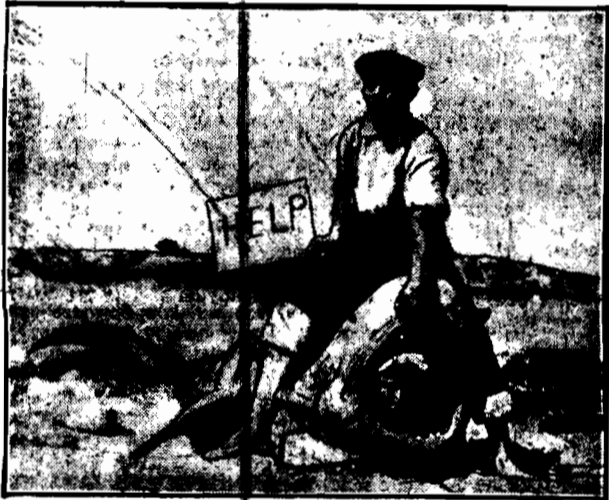
Na wodach archipelagu bermudzkiego złapano oibrzymiej wielkości rekina, w którego wnętrzu dorosły człowiek zmieścić się może.