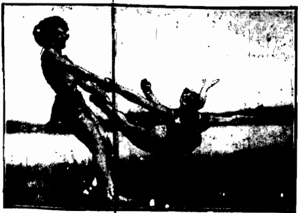
Para tancerek wschodnich Hameda Sali przy wykonywaniu figury tanecznej wspaniałej karuzeli.