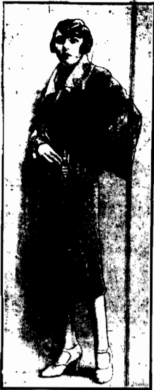
Plaszczyk z zarzutką ze strusich piór. Mo tego gładka sukienka z crepe de Chine ozdobiona ornamentami.