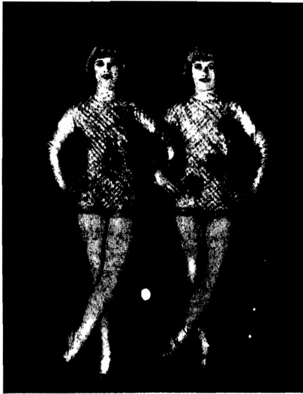
Scena z wielkiej rewii „Casino de Paris”, wyświetlana z dużym powodzeniem w kinach warszawskich.