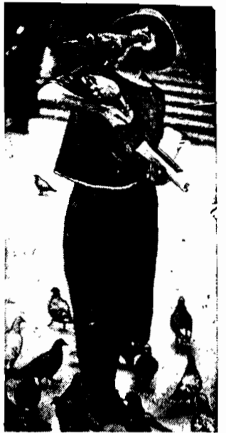
Na placu przed giełdą w Londynie zerują całe chmury gołębi. Ptaki te są tak oswojone, że siadają na głowach i ramionach przechodniów.