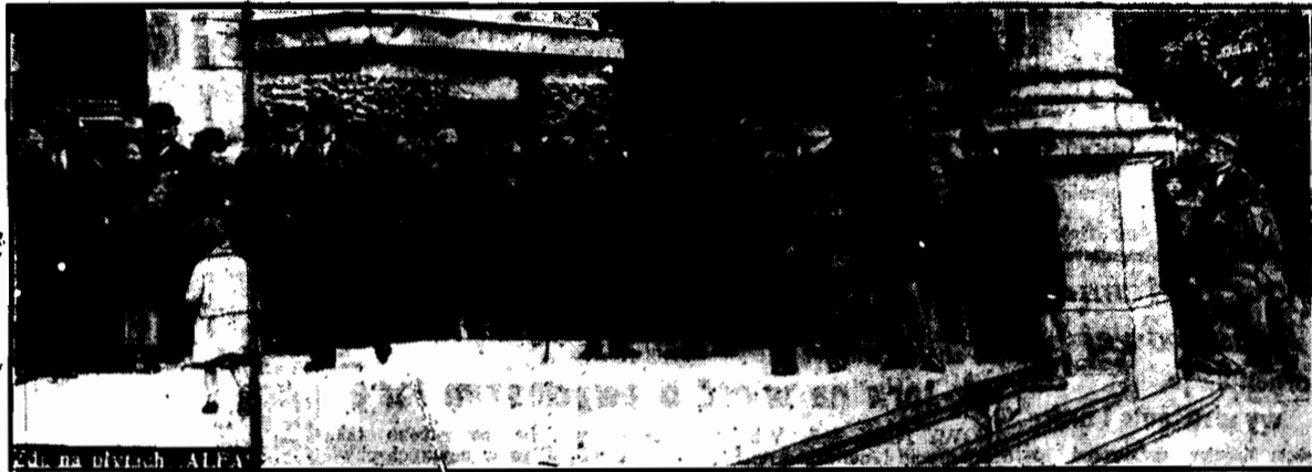
Długie sznury wyborców od rana zaległy ulice przed biurami wyborczymi.

47 przedstawicieli prawicy (lista nr. 12), 28 przedstawicieli P. P. S. (lista nr. 2), 16 przedstawicieli Centrum Demokratycznego (lista nr. 25), 2 przedstawicieli N. P. R. (lista nr. 11) czyli: 93 radnych Polaków i 27 radnych Żydów