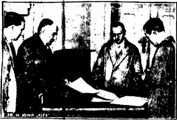
Stolica już wysoko święciła na niebie, gdy prezes komisji nr. 160 dostarczył urnę i obłożenia głos. w do Ratusza.