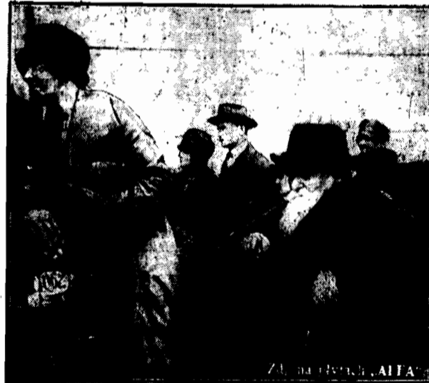
Senior socjalizmu polskiego Bolesław Limanowski w drodze do biura wyborczego swego okręgu w Politechnice.