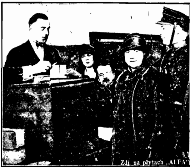
Zdł. na płytach „ALFA”