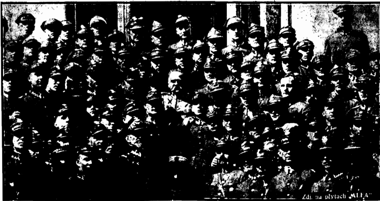
Zdł. na płytach „ALFA”

Wycieczka do stolicy wywarła głębokie wrażenie na uczestnikach podoficerach - Wielkopolaczach. Niewątpliwie najmiłym wspomnieniem będzie dla uczestników wycieczki audjencja u Mar-