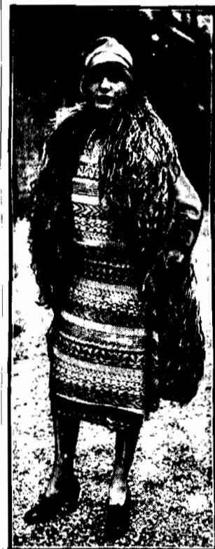
letni płaszcz z granatowego crepe de Chine ozdobiony haftem.