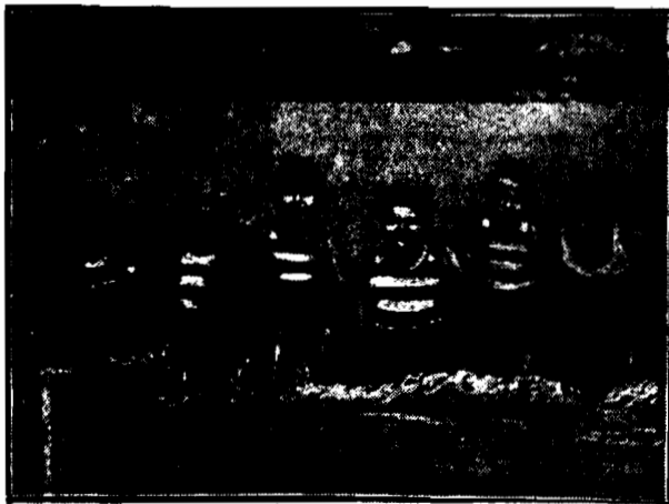
Male gwiazdy filmowe amerykańskie we wspólnej kąpiel.