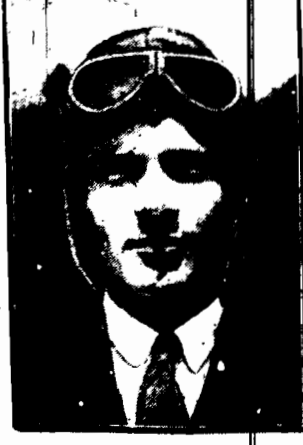
Lotnik amerykański, pomimo niepowodzenia lotu Nungessera, w tych dniach postanowił dokonać lotu przez Atlantyk.