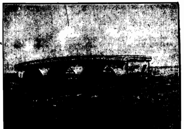
Most na Missisipi zniszczony przez fale.