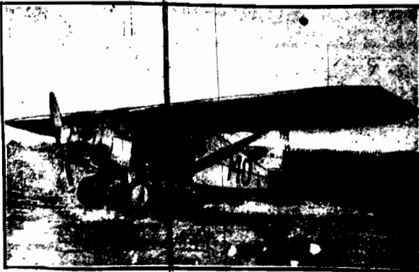
Niezręcznym przykładem zaginionych lotników francuskich Nungessera i Cobi, dwóch amerykańscy Chamberlain i Bertaud wyruszają wkrótce w drogę z Nowego Jorku do Paryża bez lodowata. Na zdjęciu samolot gotowy do rzytkowej podróży.