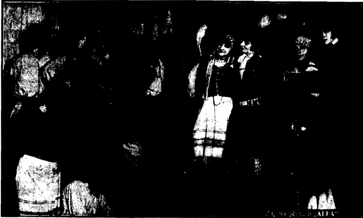
W Świetlicy dziewcząt pracujących, utrzymywanej staraniem „Koła Polek” na Pradze (Tarchomińska nr. 12) odbyła się w tych dniach seria przedstawień „Pieśni ludowych” w kostjumach etnograficznych.

Zespół 25 młodych artystek-amateerek wywiązał się z powodzeniem z tego zadania, pełnego uroku i wdzięku, jak widzimy to na fotografi, przedstawiającej obraz pt. „Wiosna i Zorza”.