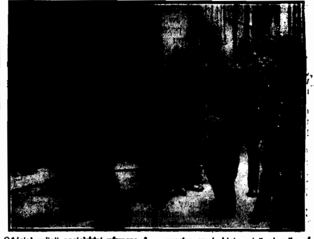
Oddział policji angielskiej wraca do gmachu sowieckiej misji handlowej w Londynie