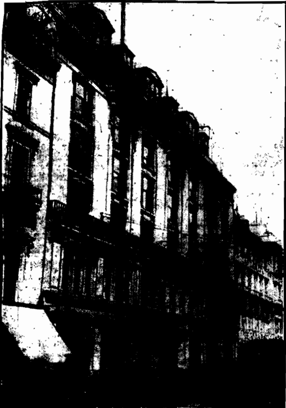
Tak doniosły decyzyje, policja zajęła gmach sowieckiej misji handlowej w Londynie i przeprowadziła tam rewizję, która dała wyniki sensacyjne.

Gmach sowieckiej misji handlowej w Londynie