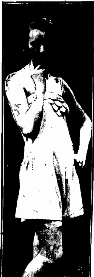
„Combinolson” jedwabne, zamiast koszuły dziennej i majteczki. Nowością są ozdoby naszywane.