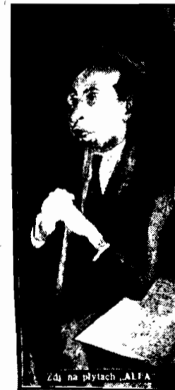
Zdjęcie na płytach „ALFA” ANTONI SŁONIMSKI