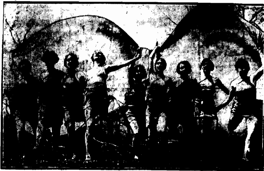
Zespół baletowy na ćwiczeniach porannych pod gołym niebem.