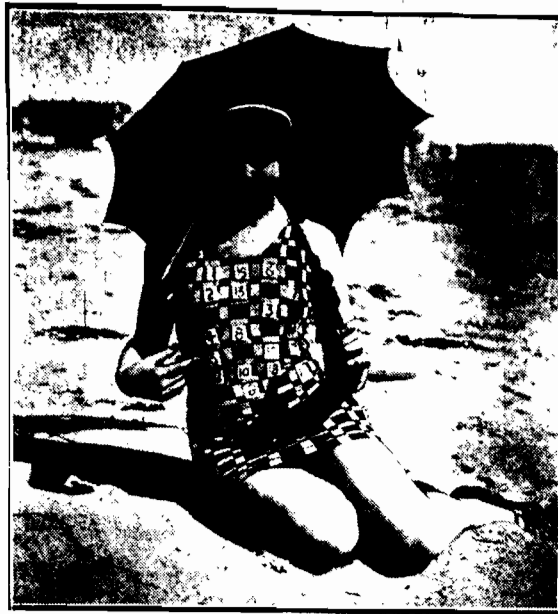
Na plaży w Kalifornii ukazała się dama w kostiumie kąpielowym, mającym na białcie t. zw. „krzyżówkę”.