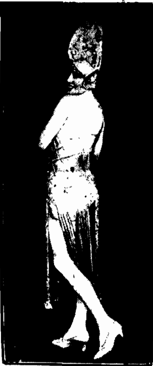
Gwiazda rewii francuskiej „Vive la Femme” na gościnnych występach w Berlinie.