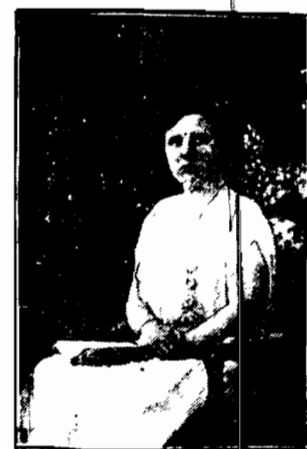
Księżniczka Julanna następczyni tronu holenderskiego skończyła 18 lat i z tego powodu weszła jako członek do Rady Stanu.