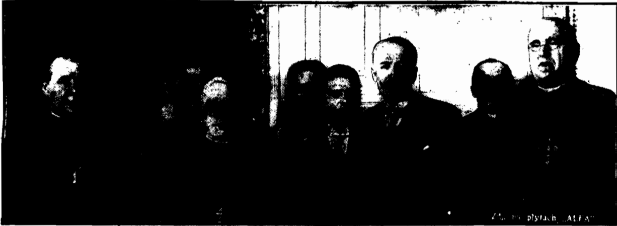
Ks. kard. Bourne na audjencji w Zamku.