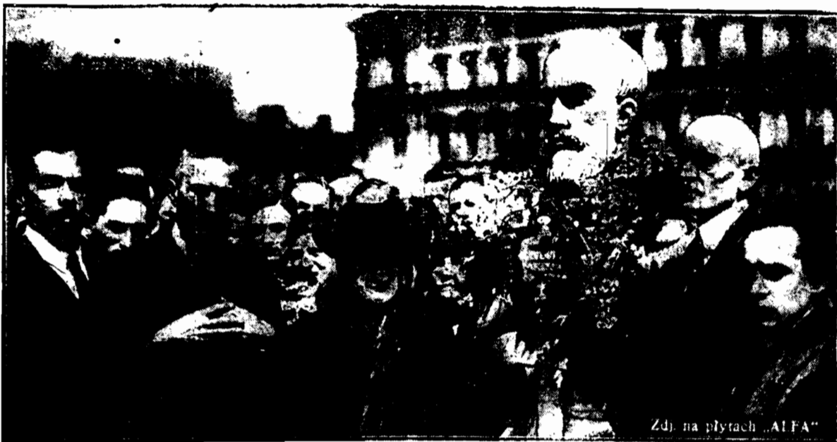
Zdj. na płytach „ALFA”

Imponująca manifestacja w Warszawie przed popiersiem Mireckiego -- Montwiła