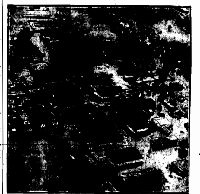
Zdjęcie z aeroplanu zalanych przez wodę okolic Nowego Orleanu.