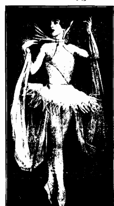
wiedeńska tancerka, pochodząca z wyjątkowo arystokratycznych warstw