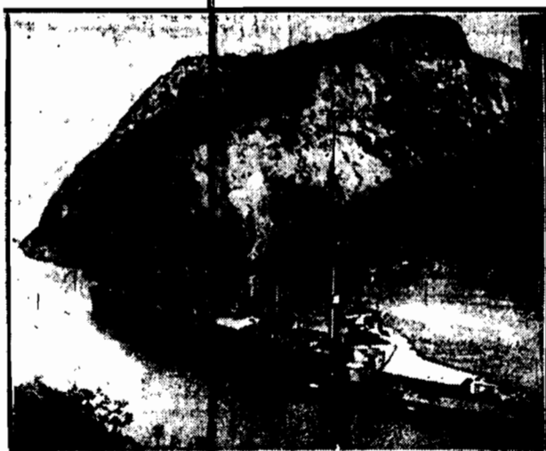
Kraźownik amerykański u wejścia do kanału Panamskiego.