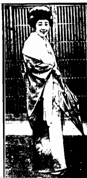
Gwiazda ekranów japońskich Joshiko Okada