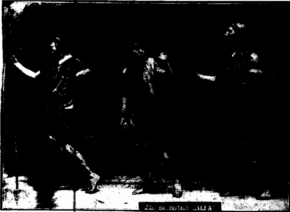
Grecki teatr Raymonda Duncana. (Str. 2).