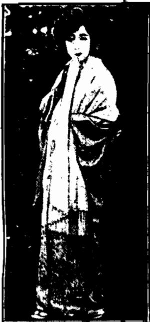
Świecna artystka filmowa Yo-Ko-Umemura