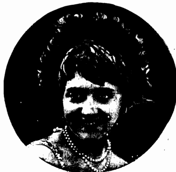
Wieczorowe uczucie. Stylizacja włosów z...