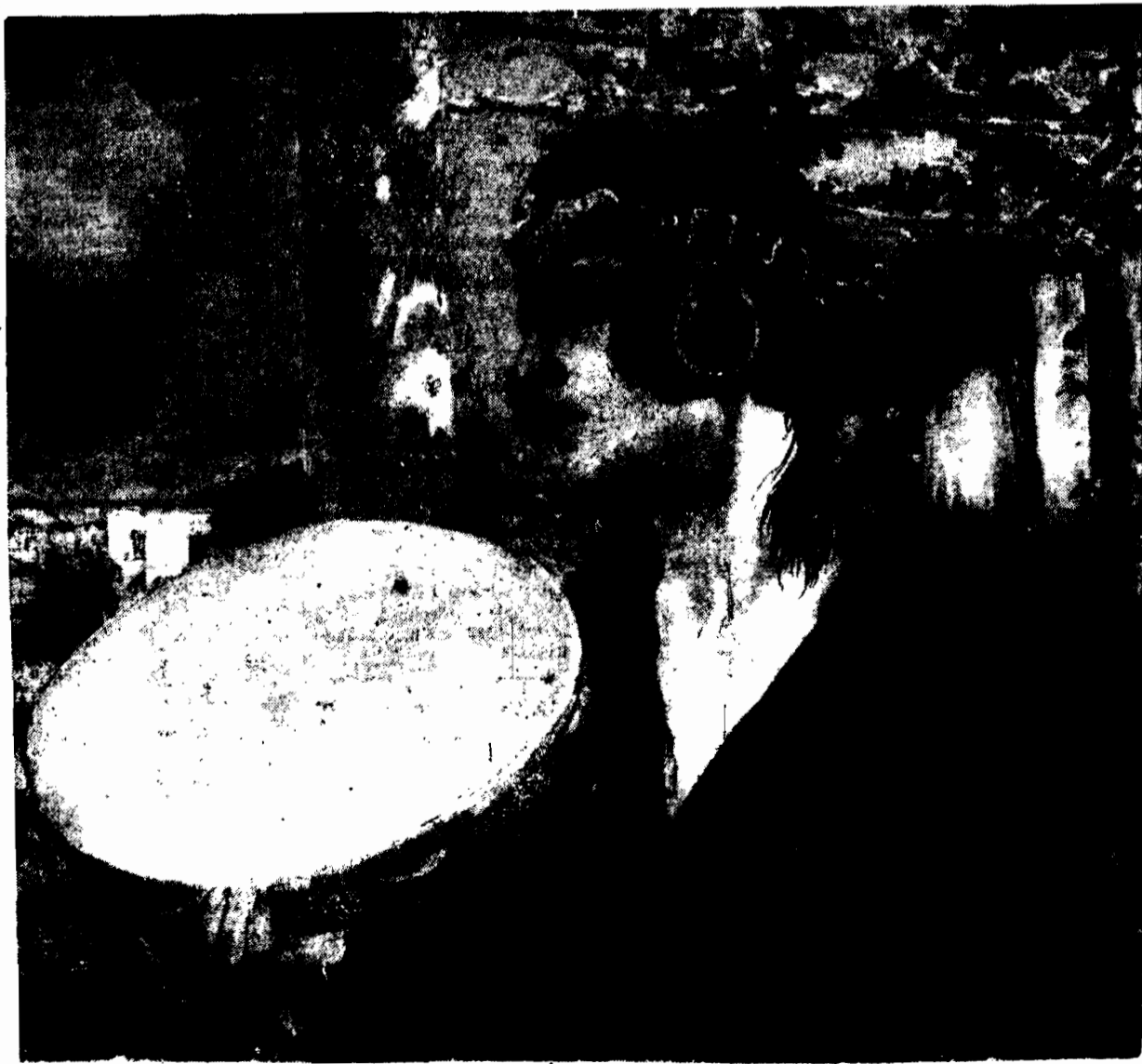
Malował F. M. WYGRZYWAŁSKI