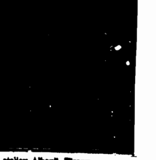
Zdjęcie zrobione na jednej z ulic stołcy Albanii, Tirany.