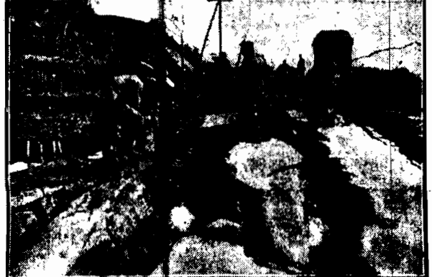
Saperzy przy naprawie szos