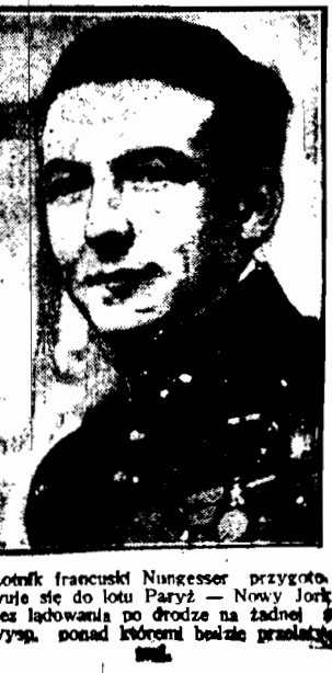
Lotnik francuski Nungesser przygotowuje się do lotu Paryz — Nowy Jork bez lądowania po drodze na żadnej wysp. ponad którym bieżące proroctwa.