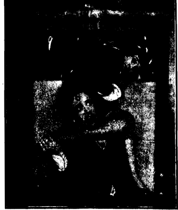
Fragment nowego filmu wytwórni First National „Zobaczymy się w więzieniu“