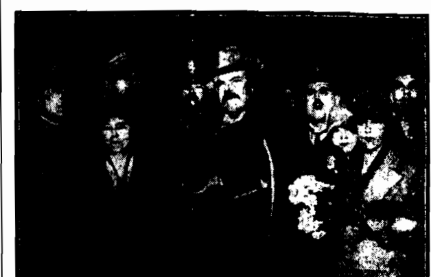
G. K. Chesterton z małżonką i sekretarką na dworcu Głównym w Warszawie