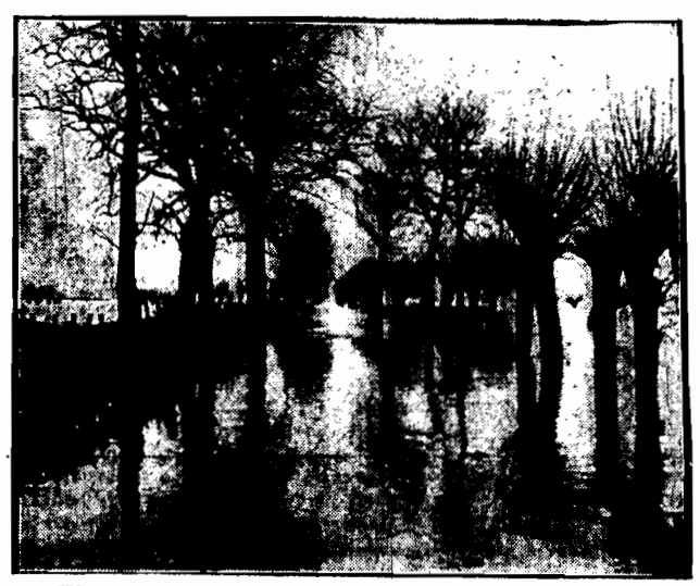
Wiosenny wylew Łaby w roku bieżącym zamienił się w wielką powódź. Rozległe przestrzenie nadbrzeżne stoja pod wodą. Drogi zamieniły się w rwące potoki. Komunikacja kołowa między wielu miejscowościami przerwana.