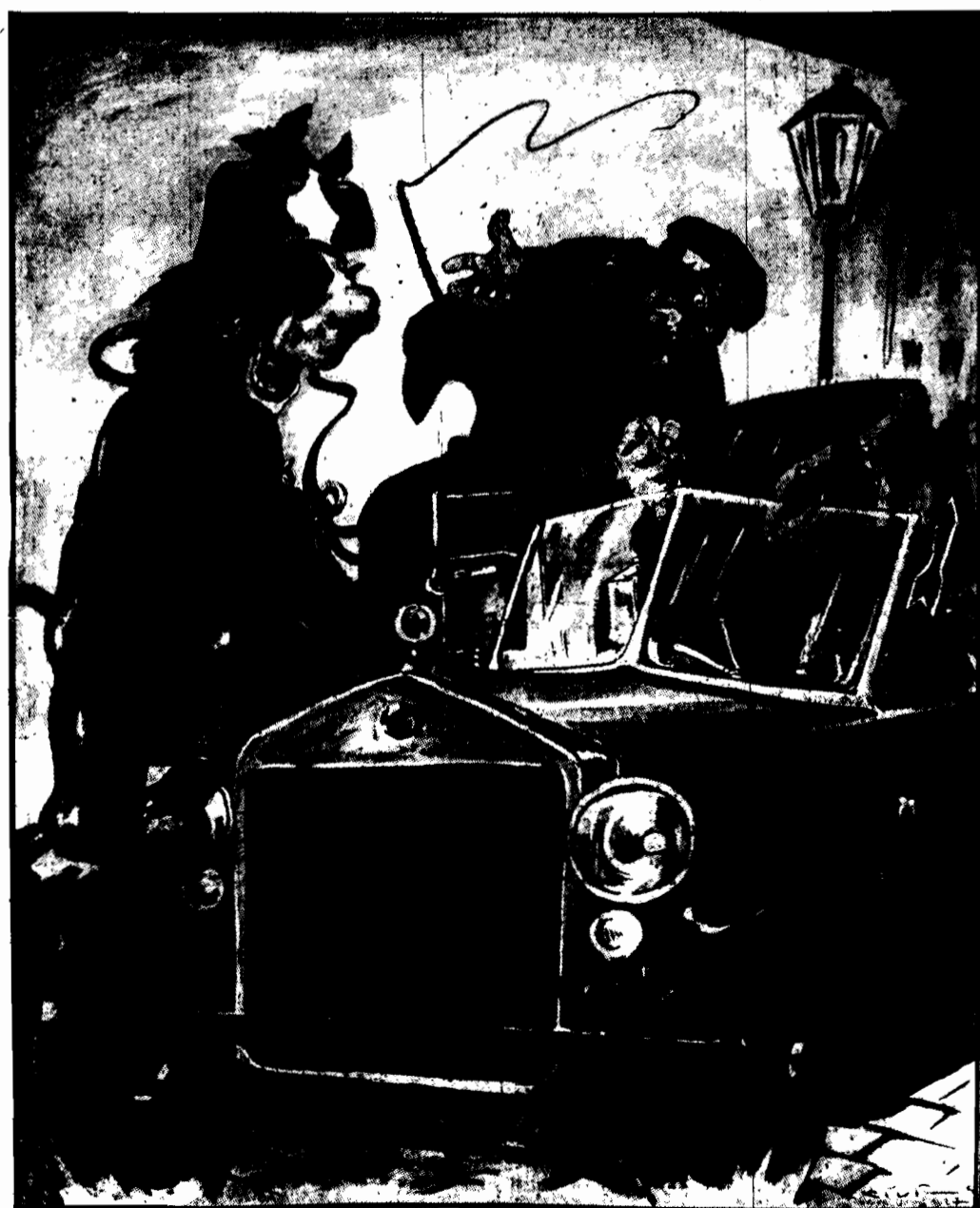
czyli „Dział z Brytanem na klasnej ulicy”