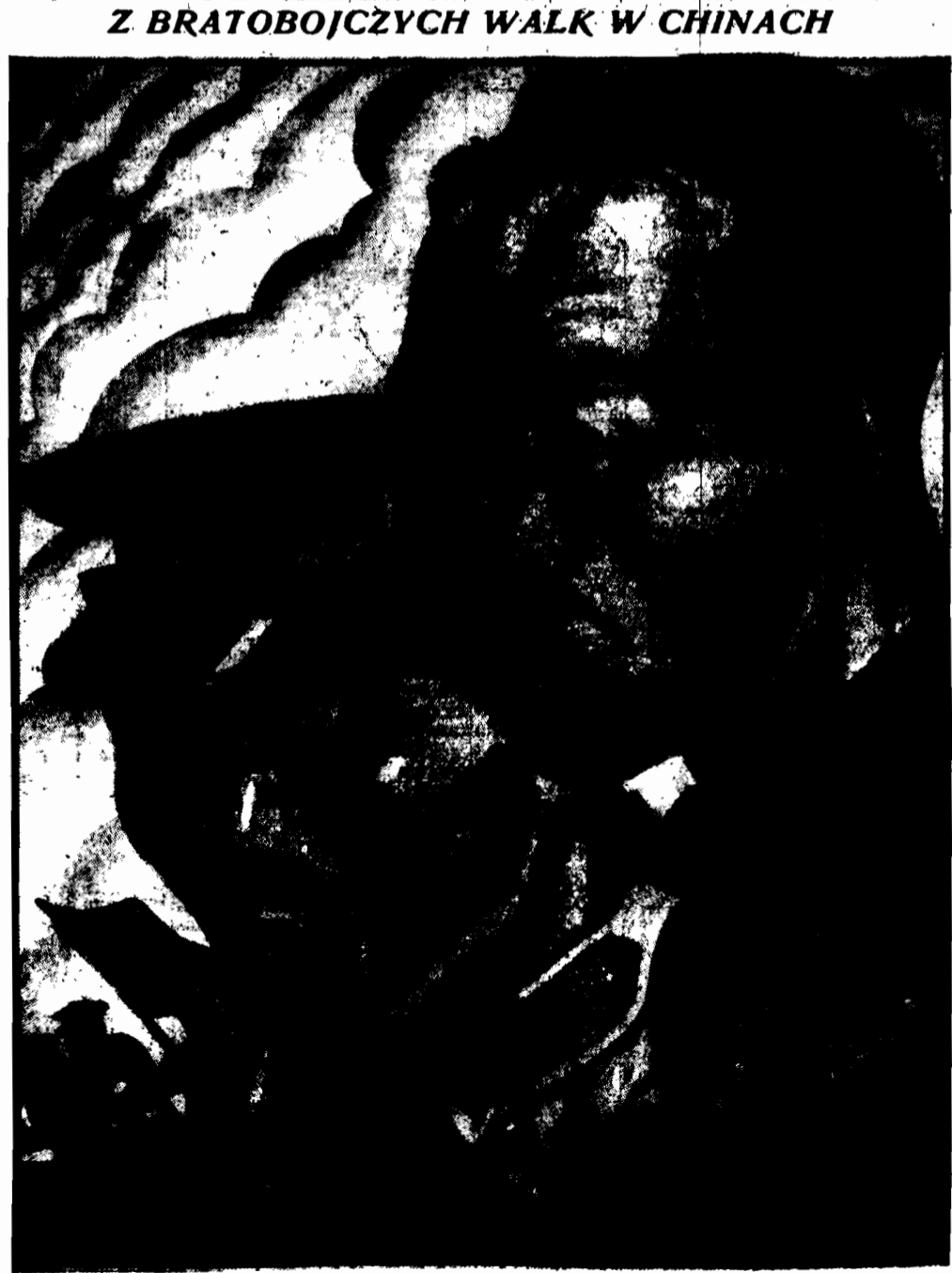
Z BRATOBOJCZYCH WALK W CHINACH