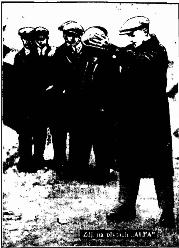
Zdj. na płytach „ALFA”

Pomimo zakazu ze strony władz kanonada świąteczna w roku bieżącym była nie a nie mniejsza, niż lat poprzednich.