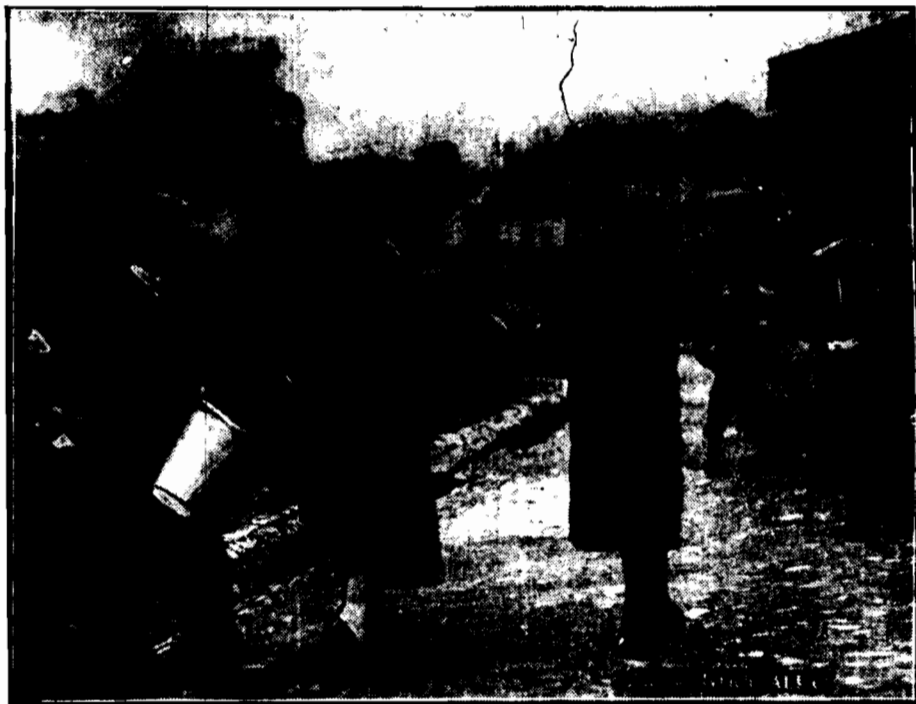
W drugi dzień świąt Wielkiej Nocy niebezpiecznie było przechodzić więcej ustronnymi ulicami miastu z powodu całych hord uliczników, czyhających na niebacznych przechodniach z butelkami, a nawet kablami wody. Zwyczaj „Dyngusu” trwa w całej sile.