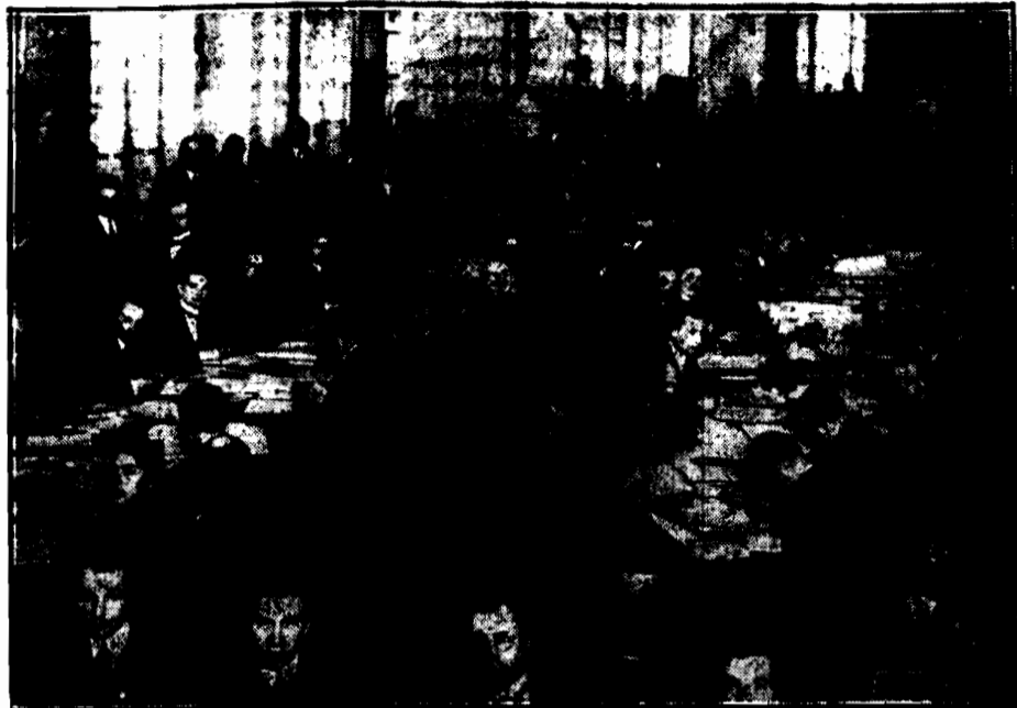
W Warszawie rozpoczęło prace specjalne biuro, którego zadaniem jest układanie list mieszkańców miasta, uprawniających do głosowania w nadchodzących wyborach do Rady miejskiej. Biuro to zatrudnia kilkaset pracowników.