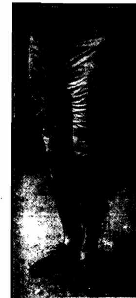
Krótkie, obcisłe spodnie i pończochy. Moda ta przypomina stroje męskie z czasów rewolucji francuskiej.