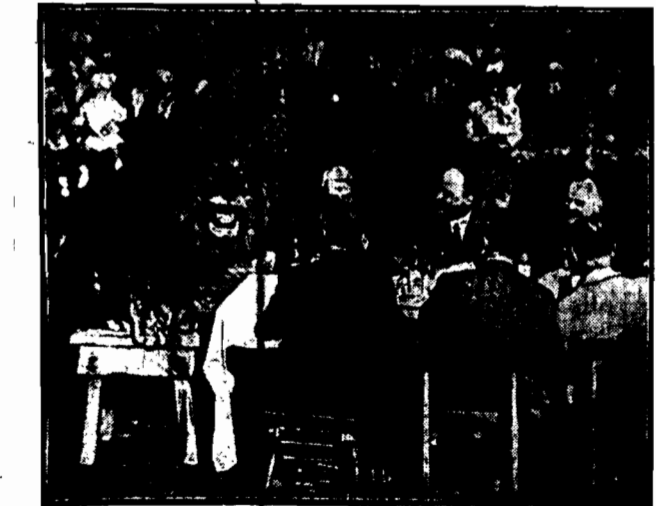
„Klub poszukiwaczy przygód” w Los Angeles wydał śniadanie w lwiej klatce.