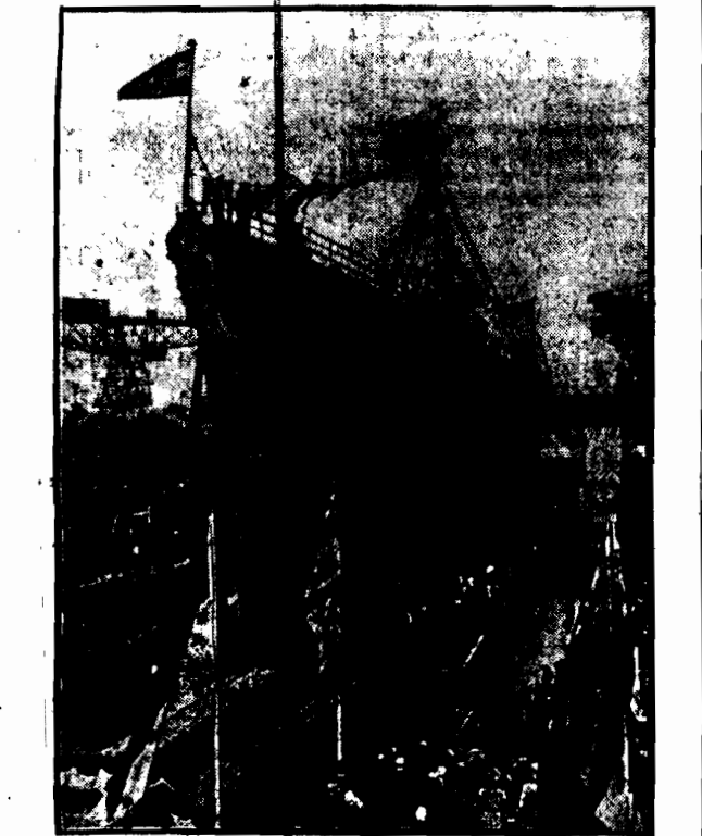
Spuštění na wodę nowego krawowika niemieckiego „Königsberg“ odbyło się w tych dniach w Wilhelmshaven.