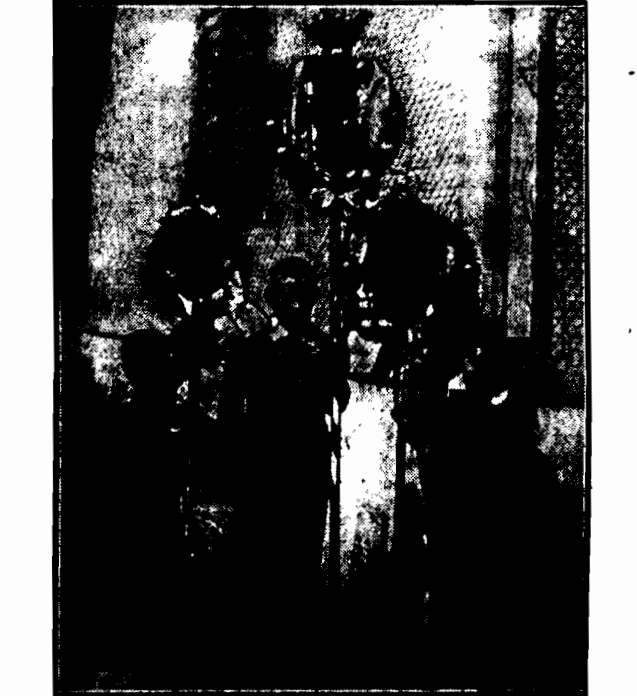
W wielu wioskach w Szwajcarii w niedzielę palmową chłopcy chodzą z kwiatami przybranymi gałązkami kwiatów i owoców.