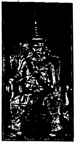
Naistarszym panującym z pokroju wszystkich monarchów świata jest 80-letni król Kambojdy (Indochiny).