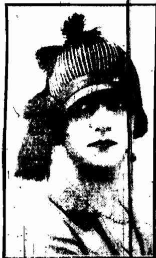
choć skromny klosk, przybrany czarnymi crossami