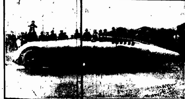
Żanickobud, skonstruowany przez majora armii angielskiej Seagrova