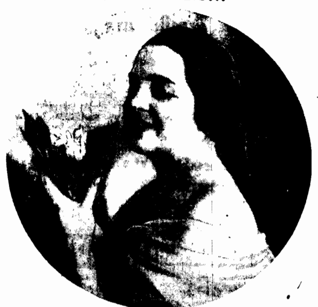
Radują się ludzie wiosnie, słońcu, kwiatom, radują się kwiaty w rączkach urodziwej pani.