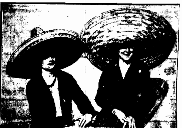
Aby się uchronić od niemodnej już opalenizny, piękne Kalifornki noszą kanelusze takich rozmiarów