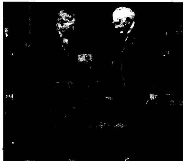
Dwaj najwybitniejsi synowie Ameryki: Edison i Ford