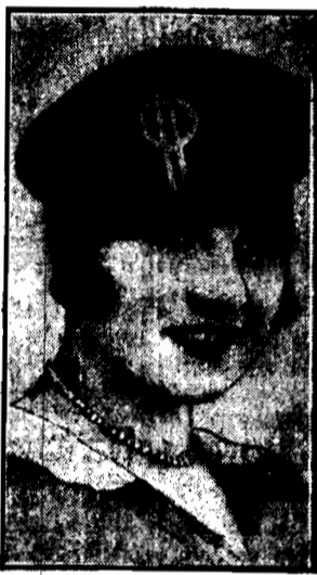
Najnowszy model paryski: kapelusik z czarnego sukna, oblamowany satyną i splety ozdobną broszą