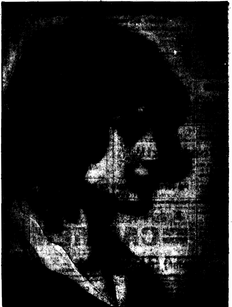
Mal. M. Zawadzki

— Poincare oświadczył na wczorajszym posiedzeniu Izby francuskiej, że zamierza utrzymać obecny kurs franka przez czas dłuższy. — Stan króla hiszpańskiego, chorującego na gripę, poprawił się. Król już konwersuje z ministrami. — W pobliżu Bordeaux spadł do morza francuski aparat lotniczy. Obaj piloci zgineli.