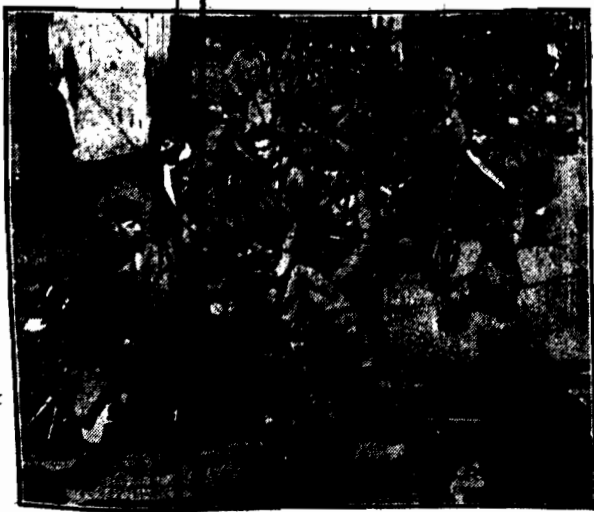
Deszcz, pociąg marynarski francuskiej, której oddziały, uzbrojone w karabiny maszynowe, przeciągał w kierunku Szanghaju, w którym mała broń koncept francuskiej.