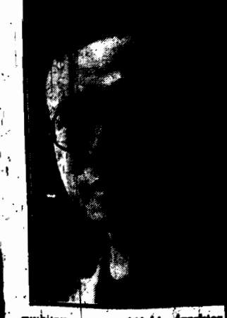
wybitny uczoney chiński, dyrektor rządu walczył z dżumą w Mandżurii, był w Warszawie, aby zorganizować Państwowym Instytutem Higieny

Załatwi, czy nie załatwi SEJM ustawy samorządowe Zakład o 200 zł. między posłami