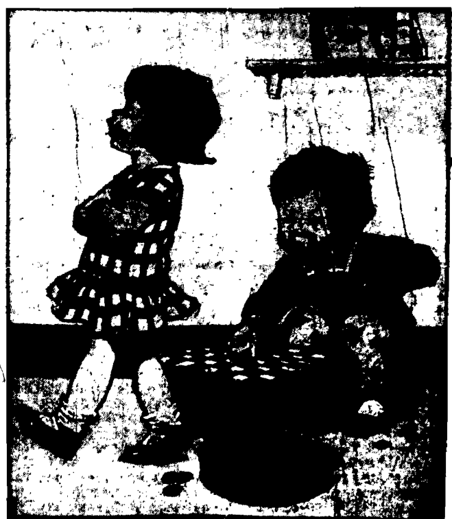
„NIE BAWIE SIĘ ZE SPŁATKACZAMI”