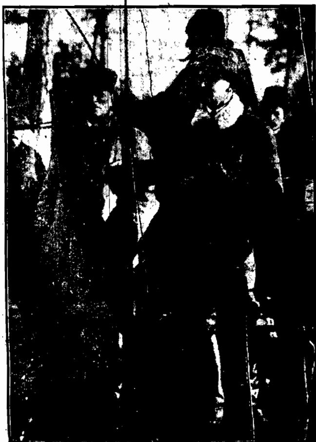
Dnia 1 lutego minął okres polowania na zające. Ilustracja przedstawia myśliwych, wybierających się na ostatnie polowanie na zające.