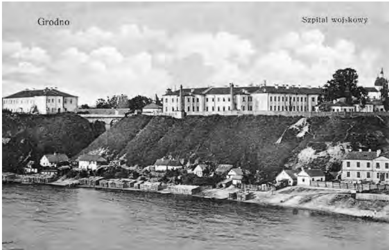
Szpital wojskowy w Grodnie ok. 1920 r. (pocztówka w zbiorach Biblioteki Narodowej)

Kałuż, Szpital Powszechny, ul. Doliniarska 12 Kamieniec Litewski, Szpital Powiatowy Kobryń, Szpital Powiatowy, ul. Legionów 98 Knyszyn, Szpital Sejmikowy, ul. Poniatowskiego 106 Kojrany, Oddział Psychiatryczny Klinik Chorób Nerwowych i Umysłowych Uniwersytetu Stefana Batorego w Wilnie Kołomyja, Szpital Powszechny, ul. Gliniana 26; Szpital Żydowski, ul. Majora Gniadego 76 Korzec, Szpital Rejonowy, ul. Hallera Kosów Huculski, Szpital Powszechny, ul. Szpitalna 16 Kosów Poleski, Powiatowy Szpital Publiczny, ul. Kościelna 1 Kowel, Szpital Powiatowy, ul. Łucka 78; Szpital Gminy Wyznaniowej Żydowskiej, ul. Łucka 85 Krynyki, Szpital Rejonowy, ul. Grodzieńska 1 Krzemieniec, Szpital Powiatowy, ul. Kaczkowskiego 3; Szpital Izraelski, ul. Górna 7