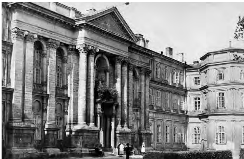
Szpital Państwowy Powszechny we Lwowie (pocztówka w zbiorach Biblioteki Narodowej)