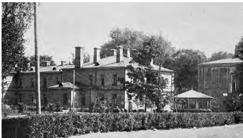
Szpital wojskowy w Brześciu nad Bugiem ok. 1936 r.

Brześć n/Bugiem, Szpital Miejski św. Józefa, ul. Jagiel- łońska 80; Szpital Kolejowy, ul. Mieszczarska 76; Szpital Żydowski, ul. Szpitalna 20