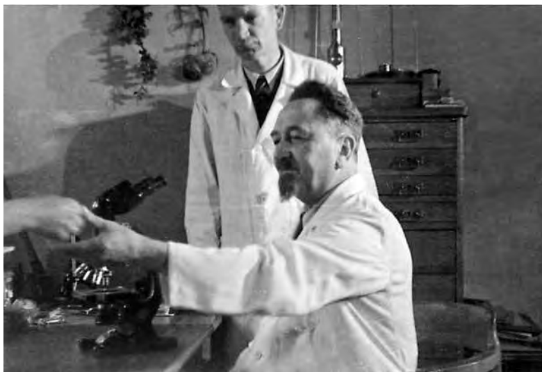
śp. prof. Rudolf Weigl (1883-1957)

Autor książki chciał specjalnie odnotować w poniższym zbiorze nazwisk postać prof. Rudolfa Weigla – profesora Uniwersytetu Jana Kazimierza we Lwowie, który w okrutnych czasach okupacji sowieckiej oraz niemieckiej potrafił uratować od zagłady wielu lekarzy, studentów, ludzi kultury i innych naukowców z uniwersyteckiego środowiska Lwowa. Wielu z nich stanowiło trzon powojennej kadry naukowej, w szczególności w ośrodkach Wrocławia, Szczecina, Torunia i Gdańska, gdzie po 1945 r. organizowano polskie wyższe uczelnie.