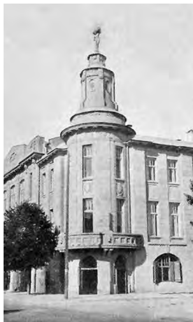
Lecznica Litewskiego Stowarzyszenia Pomocy Sanitarnej 1936 r. (broszura w zbiorach Biblioteki Narodowej)

Lwów, Uniwersytet Jana Kazimierza, Wydział Lekarski; Szpital Państwowy Powszechny, ul. Głowińskiego 7; Szpital Lwowskiej Gminy Wyznaniowej Żydowskiej, ul. Rappaporta 8; Szpital Ubezpieczalni Społecznej, ul. Kunkowa 31; Państwowy Zakład dla Umysłowo Chorych, Kulparków; Szpital Epidemiczny, ul. Janowska 130; Szpital Sióstr Miłosierdzia św. Wincentego a Paulo, ul. Teatyńska 1; Szpital Towarzystwa „Narodna Lecznica” im. Metropolity A. Szeptyckiego,