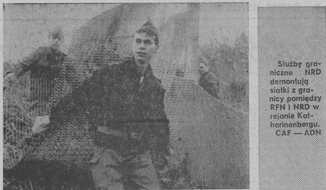
Służby graniczne NRD demontują siatki z granicy polskiej RFN i NRD w rejonie Kattinbergu.

Wczoraj przybyła do dwudniowej wizyty do Polski zaproszona przez prezidenta Wojciecha Jaruzelskiego delegacja Rady Międzynarodówki Socjalistycznej ds. Rozbrojenia (SIDAC) z jej przewodniczącym Kalevi Sorsą, przewodniczącym parlamentu Finlandii. W pierwszym dniu wizyty zostali oni przyjęci przez premiera Tadeusza Mazowieckiego oraz ministra Stanu Józefa Czurka. (PAP)