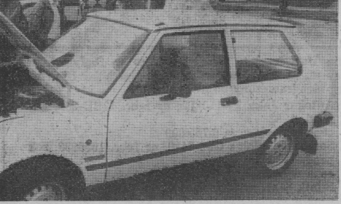
Spółka „POLMOT” oferuje samochod „YUGO” 55 oraz „YUGO 45” po obniżonych cenach: 4.000 i 3.550 dol.

— Pani Ewo! Niech mi Pani wybaczy osobiste pytanie. Jest jednak pan człowiekiem,