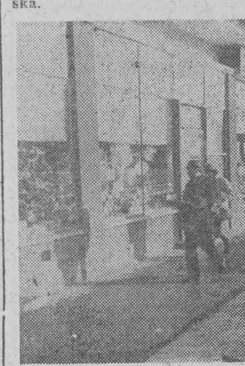
Ulice miasta „opanowali” Mikolaje. Szkoła, że wszystkie są spod tej samej szczeni.