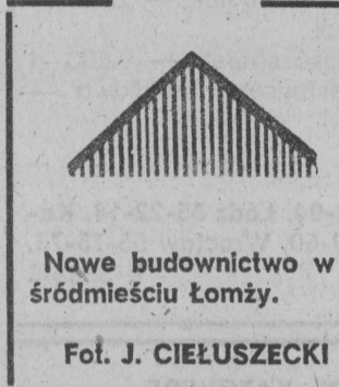
Nowe budownictwo w śródmieściu Łomży.