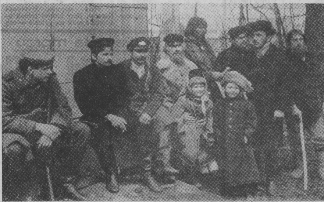
Statyści w oczekiwaniu na kolejne ujęcie.

Komu awans? Z dalszego ciągu referatu rzeczywiście przebiegają wyraźna troska o kariery młodzieżców.