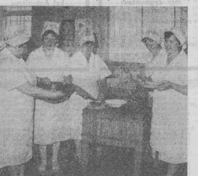
Kucharki z Łoździejów.

Decyzjami rządowymi przecięte płace w gospodarce uspołecznionej mogą w tym roku wzrosnąć maksymalnie o 50 proc., natomiast ceny — o 60 proc.