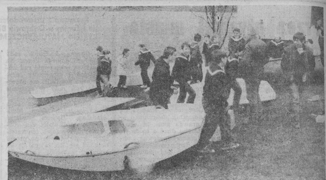
Wodniacy z Yacht Klubów wspólnie z harcerzami rozpoczęli przygotowania do sezonu. Na klubowych przystaniach już szykują sprzęt. NA ZDJĘCIU: na przystani.