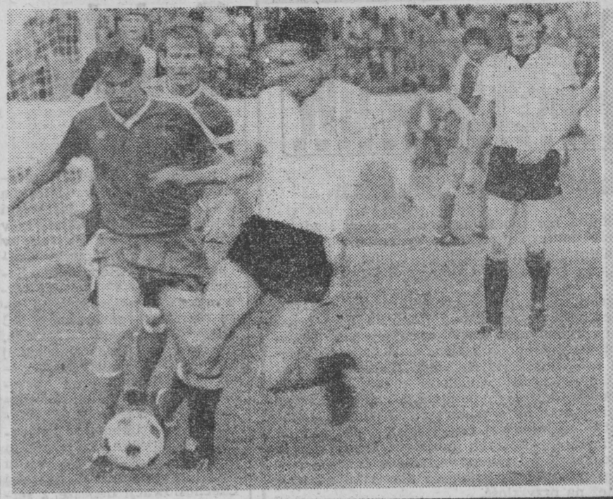
Filkarze Jagielloni w kolejnym meczu I ligi pokonali w sobotę przed własną publicznością EKS Łódź 1:0. 25 tys. widzów z zadowoleniem opuściło stadion. Po tej wygranej biało-czerwoni zajmują 10 miejsce w tabeli. Informacje sportowe na str. 6.