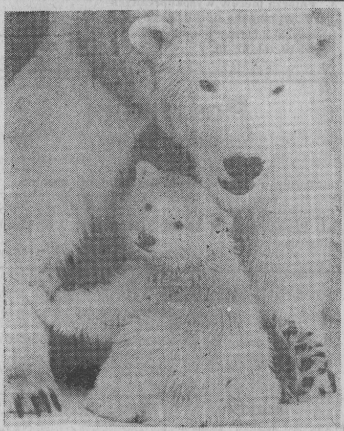
Niestety idzie ciepło...