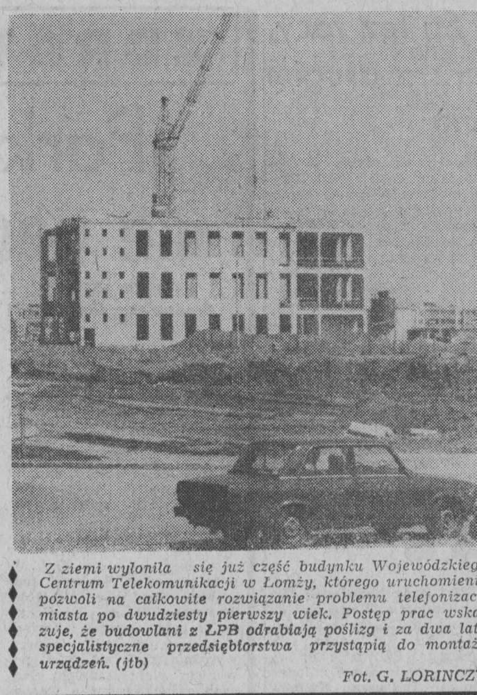
Z ziemi wylonila się już część budynku Wojewódzkiego Centrum Telekomunikacji w Łomży, którego uruchomienie pozwoli na całkowite rozwiązanie problemu telefonizacji miasta po dwudziestu pierwszych ulok. Postęp prac wskazuje, że budowlani z LPB odrabiają posługę i za dwa lata specjalistyczne przedsiębiorstwa przystąpią do montażu urządzeń. (fjb)

Podobnie będzie w innych miastach. W ZAMBROWIE wszystkie sklepy będą otwarte 30 kwietnia jak w każdą wolną od pracy sobotę i tylko w niektórych — przy ZZPB (na ul. Sikorskiego) godziny otwarcia zostaną wydłużone do godz. 17. W niedzielę — otwarte będą sklepy normalnie działające w dni świąteczne oraz dodatkowo — znajdujące się przy trasie pochodów — przy Al. Wojska Polskiego i Placu Sikorskiego. Łomżyńska komunikacja miejska pracować będzie, zarówno w sobotę i niedzielę według rozkładów jazdy, przewidzianych na dni świąteczne. (nom)