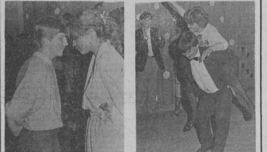
... I jeszcze taniec, ćwiczący równowagę ducha i ciała.

Dania jest najdroższym członkiem EWG. Na dru- gim miejscu znajduje się RFN. Najtańszym krajem EWG jest Portugalia. Za koszyk tych samych towarów kupionych w RFN za 100 marek zachodnio- niemieckich w Portugalii wy- starczy zapłacić 47 marek, a w Danii 118.