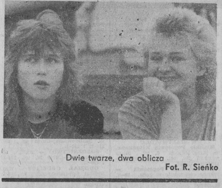
Dwie twarze, dwa oblicza

Hipologia jest nauką o koniach. Na całym świecie istnieje tylko dwa muzea hipologiczne: w Moskwie oraz w Czechosłowacji — w Slatianach koło Pardubic. W muzeum slatniańskim znajdują się zbiory porcelanowych figurek szkoły hiszpańskiej, liczne obrazy i rysunki koni wykonane przez najznakomitszych malarzy i grafików, kolekcje najróżniejszych siodeł, uprzęży i innych akcesoriów jeździeckich, szkielety wybitnych koni i inne, również ciekawe eksponaty. (O)