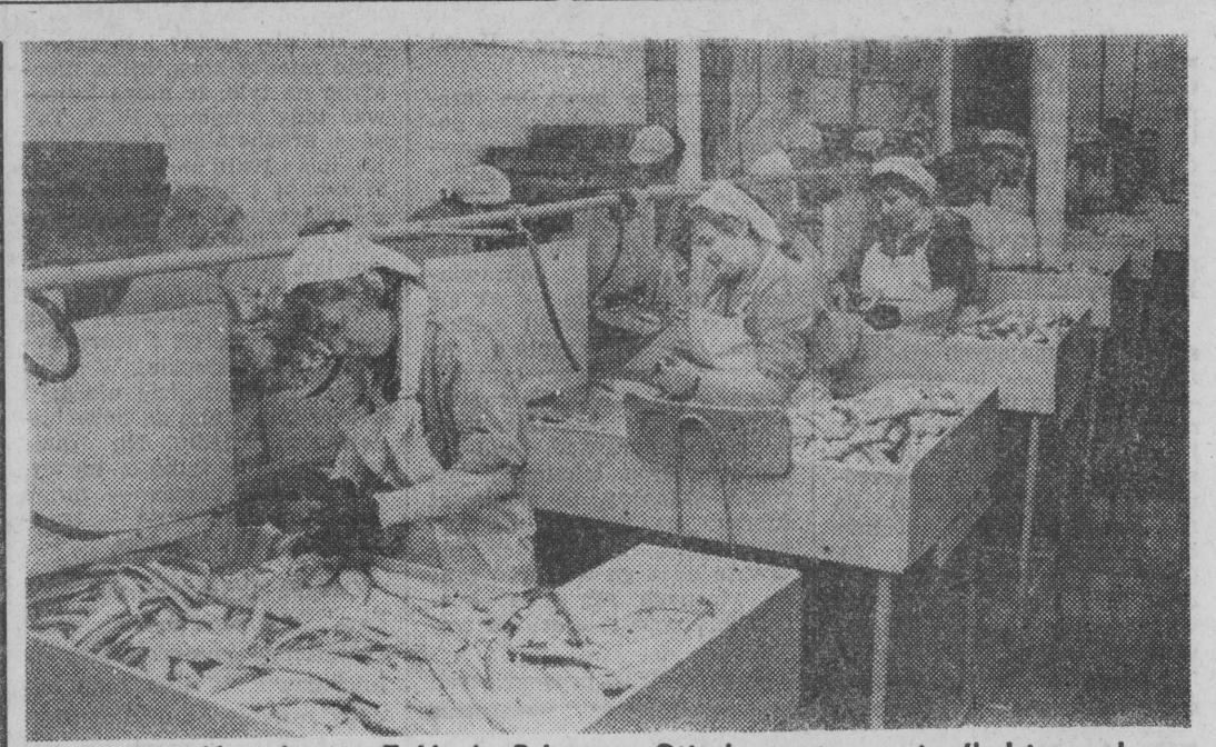
Na zdjęciu: Zaklady Rybne w Giżycku, pat roszenie śledzi przed marynowaniem. Czyli le pszy rydz, niż nic.

Kolumnę RYNEK zredagował Dział Ekonomiczny ,GW". Do druku przygotowała MARIA ROMANOW-SKA, która dziś pełnić będzie dyżur przy telefonie 211--30 w godz. 10-12.